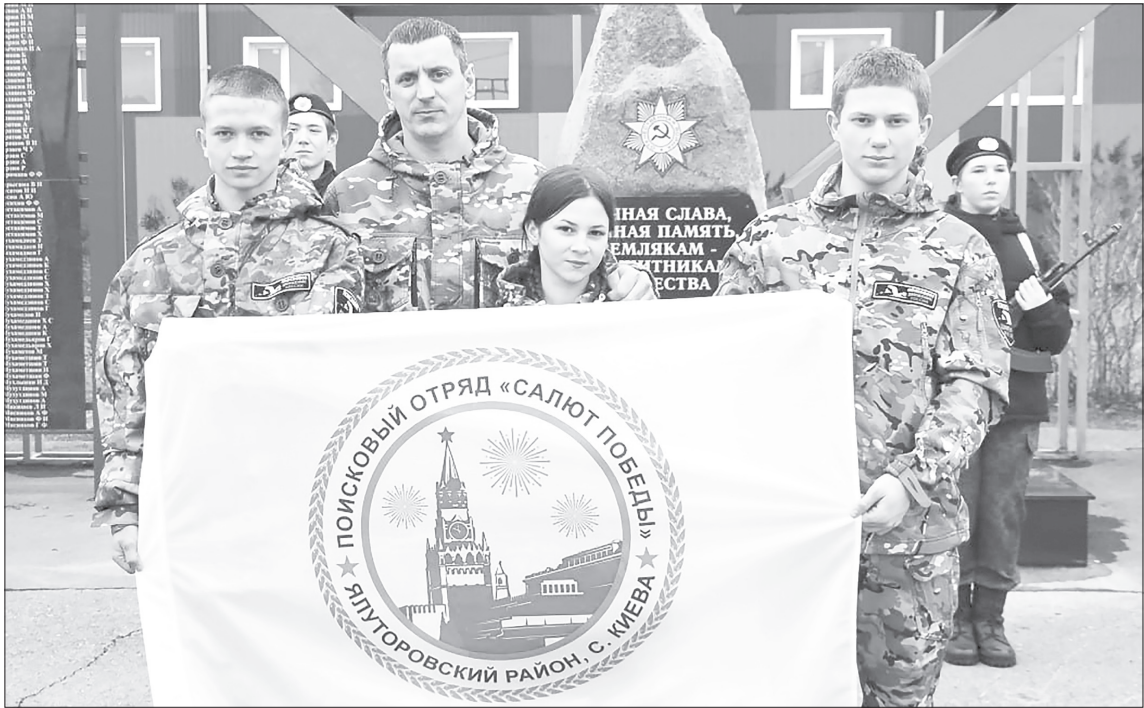
В честь отправки ребят на «Вахту памяти» провели торжественный митинг

По традиции ребята дружно произнесли клятву поисковика. Память не вернувшихся с полей сражений фронтовиков почтили минутой молчания. К памятному знаку «Алая звезда» возложили цветы.