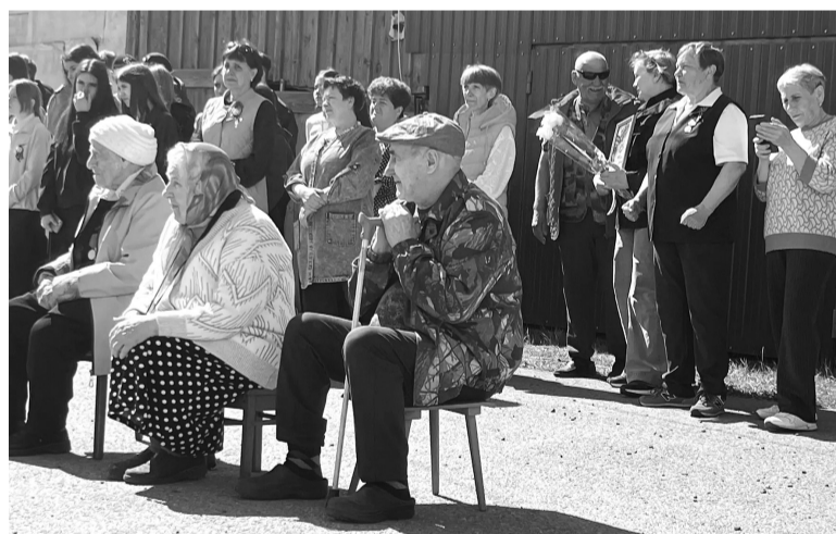
На снимках: Прямо у подъезда, под открытым небом — концерт, который не покажут по телевизору, но запомнят навсегда.