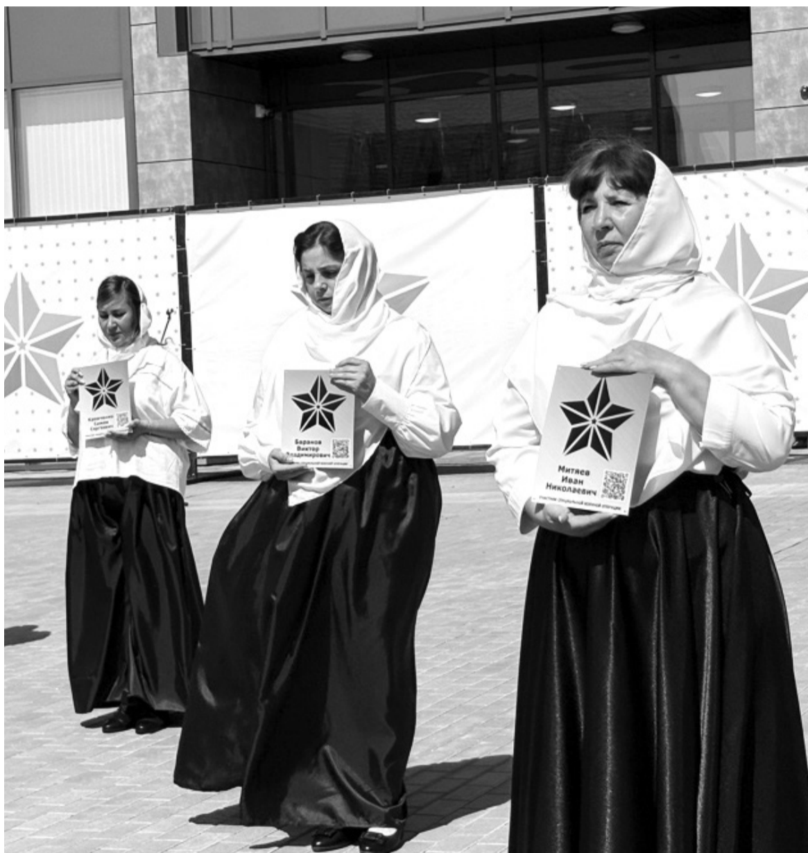
Их имена навсегда останутся в наших сердцах. В Сорокинском округе почтили память восьми героев, павших при исполнении воинского долга в зоне специальной военной операции

Патриотизм. Мемориальная акция в Сорокинском округе собрала родных, близких и земляков погибших воинов