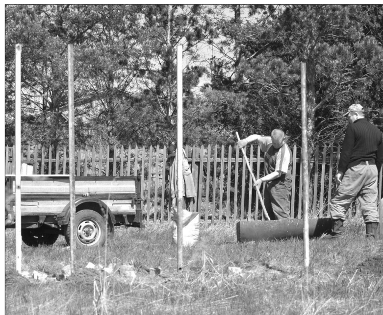
Строительство спортивно-игровой площадки в деревне Лапушина началось

Оксана ТИТЕНКО.