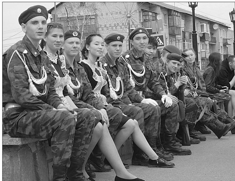
Хорошо подготовленных кадетов – девчат и парней – в смотре караулов и в военизированной эстафете оказалось немало