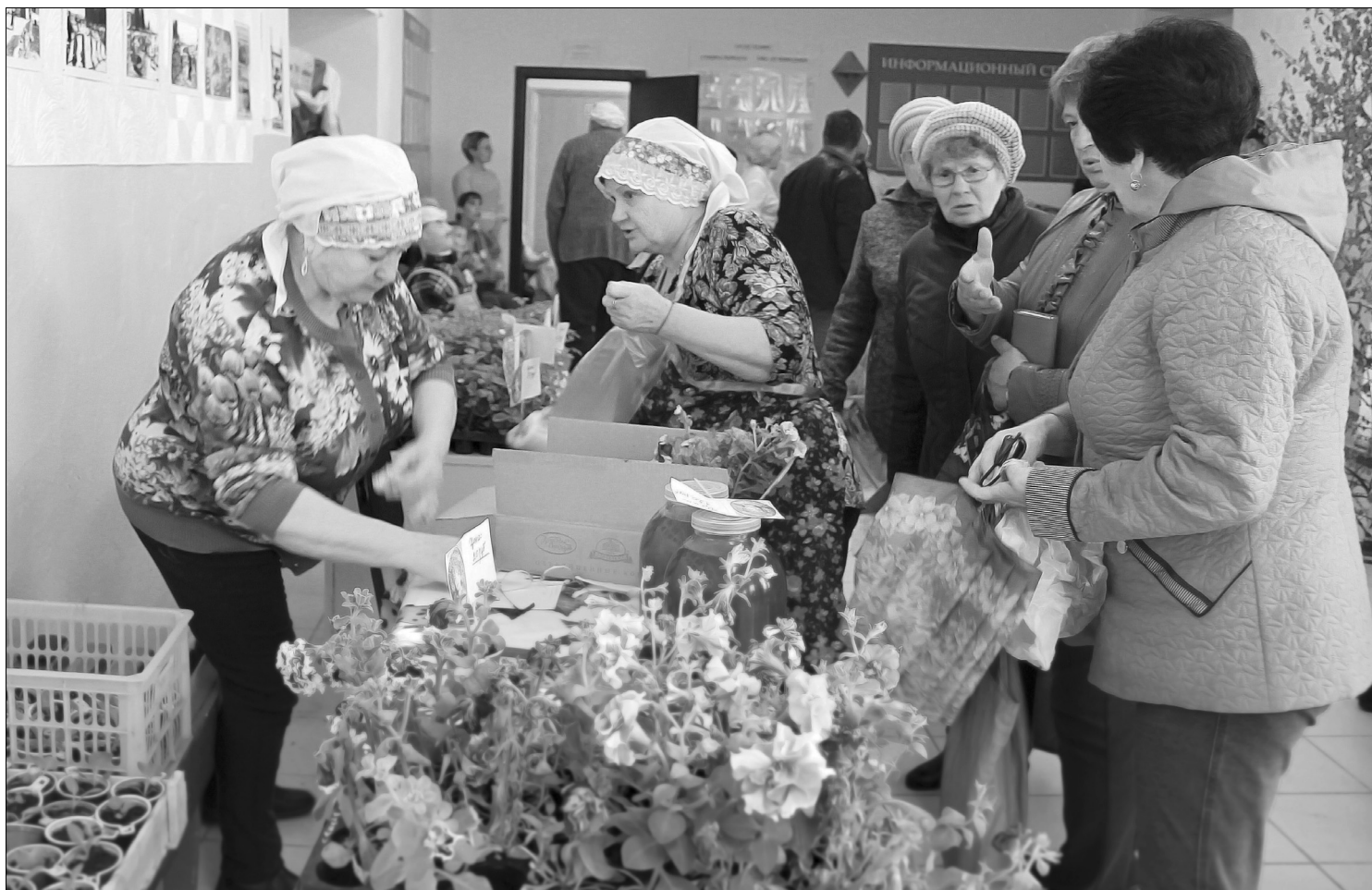
Марфа-рассадница – на радость садоводам и огородникам