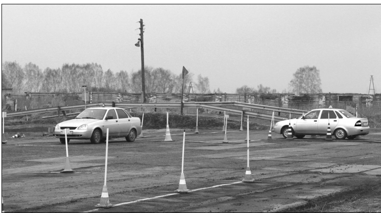
Практические навыки будущие водители отрабатывают на автодромах

Автошкола Голышмановского агропедколледжа участвует в бюджетной и внебюджетной подготовке водителей транспортных средств категорий В, С, Е. В планах – реализация программы подготовки водителей категории «Д» – автобусы.