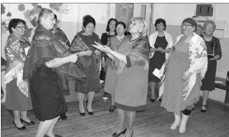
Первый концерт группы совета ветеранов одарил зрителей добром и хорошим настроением

В последний апрельский день состоялся дебют концертного коллектива районного совета ветеранов. Группа «Дари добро» дала первый концерт в Доме ветеранов, поздравляя с Первомаем и Днём Победы.