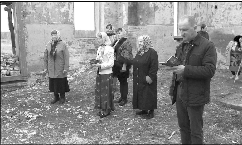
Молебен под открытым небом

В Дранкова люди молятся в полуразрушенном храме