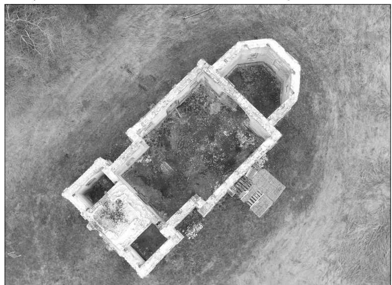
С высоты птичьего полёта храм напоминает силуэт человека

Инна АНДРИАНОВА.