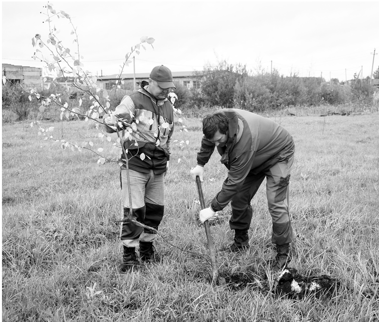
На месте пустыря лесники сажали саженцы деревьев разных пород

Работники Бердюжского участка ГКУ ТО «Тюменьлес» и Бердюжского филиала Тюменской авиабазы в течение всего года ведут работу по сохранению и восстановлению лесов и развитию лесного хозяйства в районе.