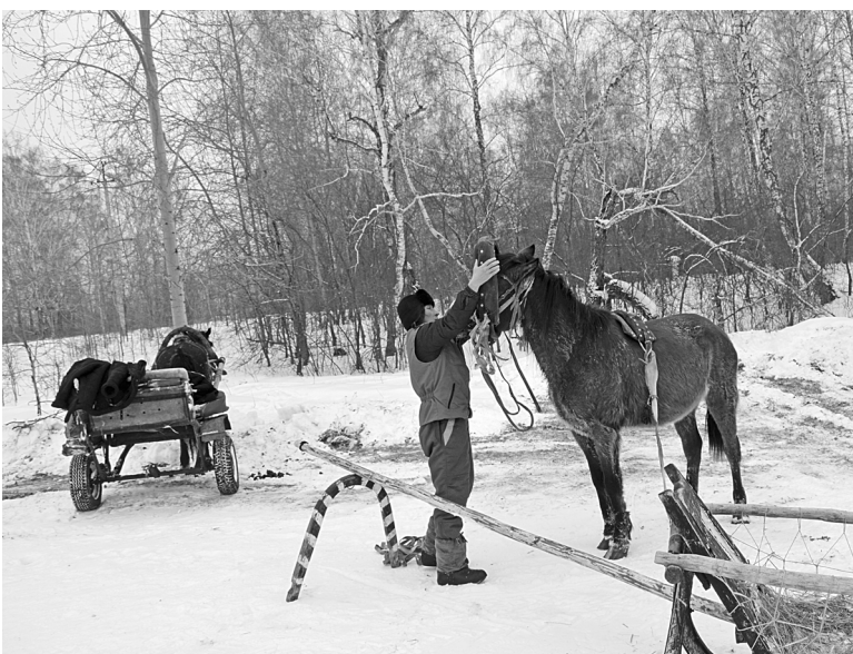
В крестьянской эстафете важна каждая секунда: нужно ловко запрячь лошадей