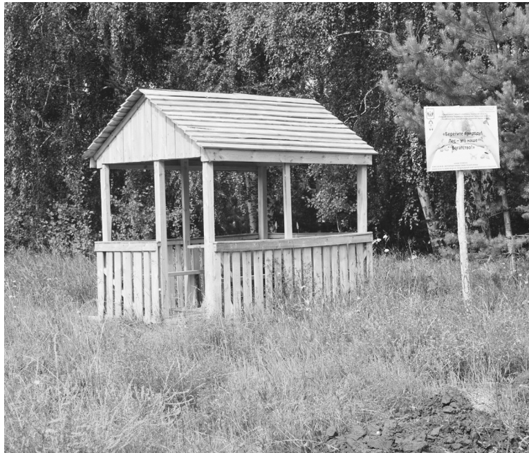
Такие аккуратные зоны отдыха в лесу были установлены в прошлом году

– Весной составляется план противопожарных мероприятий, – продолжает Николай Кених. – Так, в прошлом году с начала апреля лесники проводили отжиги сухой травы на особо опасных участках, прилегающих к дорогам и лесным массивам на всей территории района. Весной контролируемые отжиги прошли на 171,8 гектара, осенью – почти на 234 гектарах. Общая площадь контролируемых отжигов составила 405 гектаров. Также в 2020 году почистили около 250 километров противопожарных минерализованных полос, еще 150 километров проложили вновь. Было построено почти два