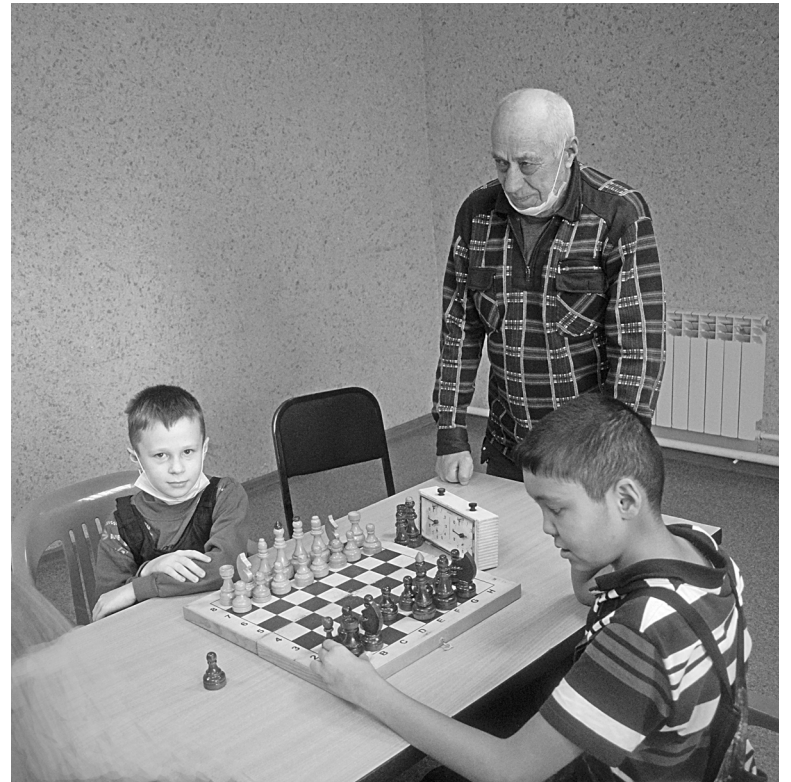
На равных со взрослыми сражались юные шахматисты

13 февраля проходила XXXVI зимняя районная спартакиада на лыжной базе, что расположена у озера Станового в Бердюжье. Участвовали восемь команд из сельских поселений района.