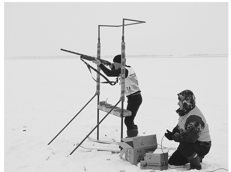
Главное для охотников – быстро прицелиться и метко выстрелить, чтобы не заработать штрафной круг