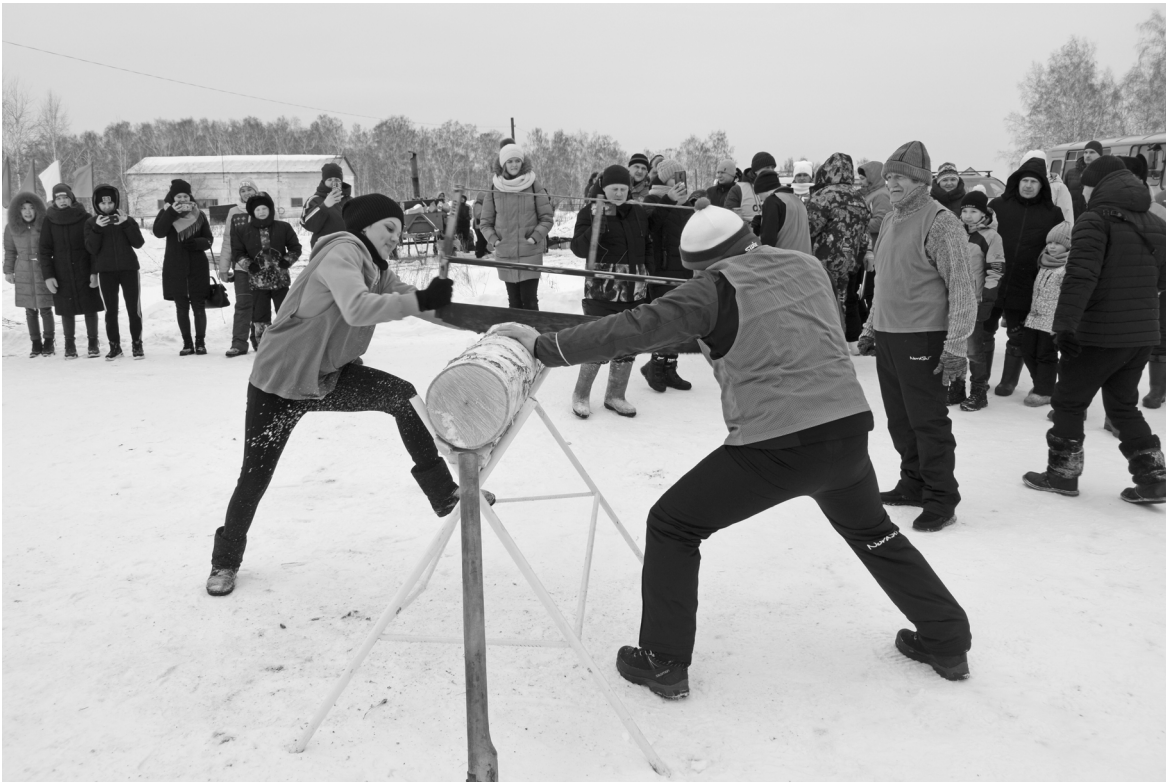
Окуневцы быстрее всех распилили бревна