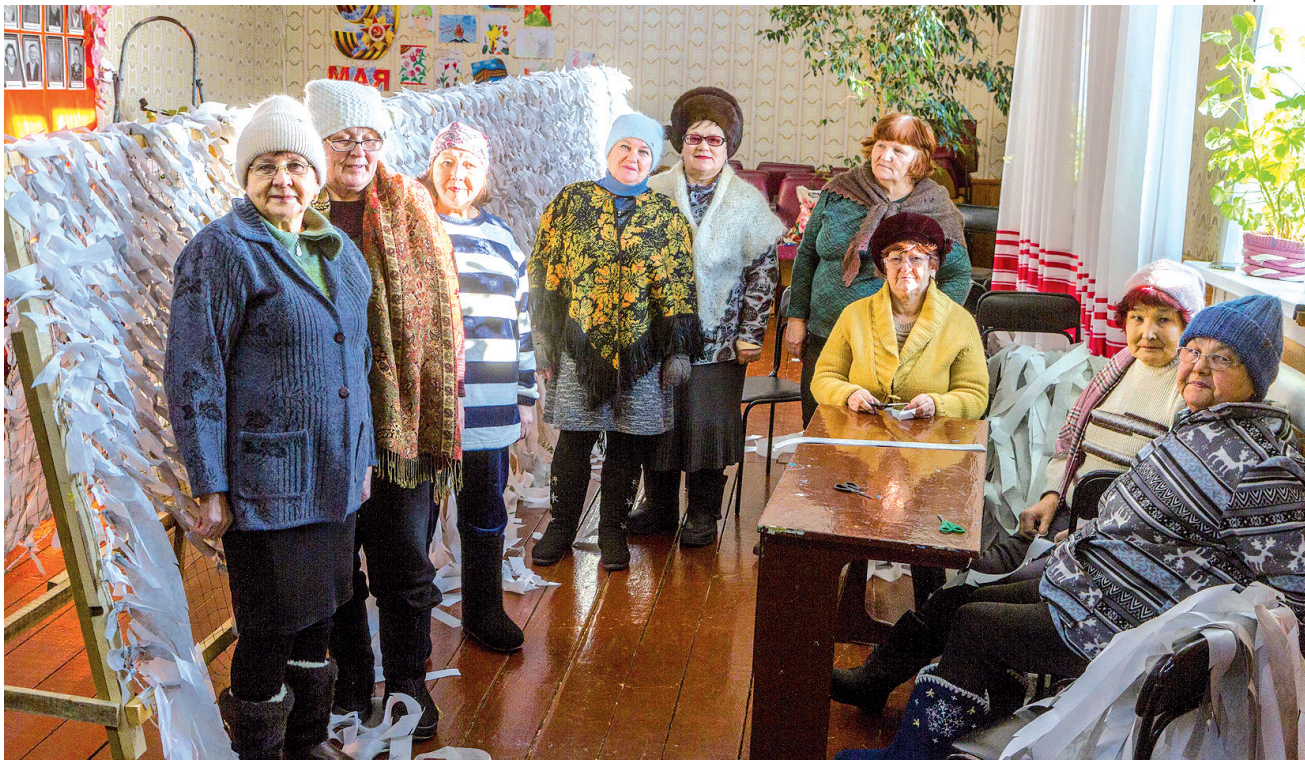
► Ермаковские волонтеры

Здесь первенство по праву отдаём нашим добровольцам, волонтерам, людям серебряного возраста, всем неравнодушным, отзывчивым, с великодушным сердцем землякам, кто собирает посылки с гуманитарной помощью, пишет проникновенные письма и открытки нашим парням, находящимся в зоне спецоперации, кто, не считаясь со временем и возможностями, откликается на просьбы бойцов, обеспечивая их необходимым на передовой снаряжением, предметами армейского быта и т.д.