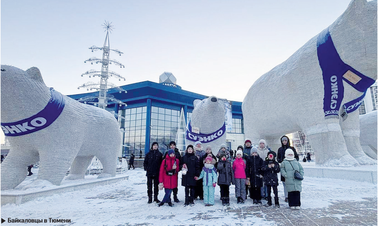
► Байкаловцы в Тюмени