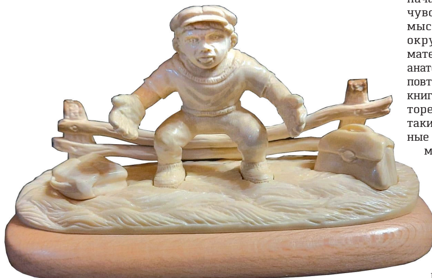
► Миниатюра Юрия Санаева «Дворовый футбол»

...Как много подарила она тепла и заботы, сколько горя вынесла! Её морщины скрыли прекрасный образ молодости. Но, несмотря на все тяготы и лишения, она живёт. И никто не спросит, зачем. Потому что любит жизнь или ещё не накопила на ритуальные услуги... Этими или иными размышлениями был отягощён один из посетителей выставки, но, по словам Юрия,