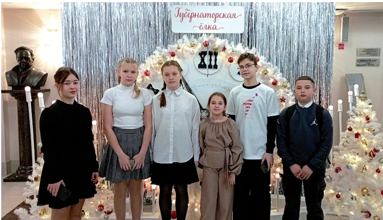
► Делегация школьников из Тобольского района