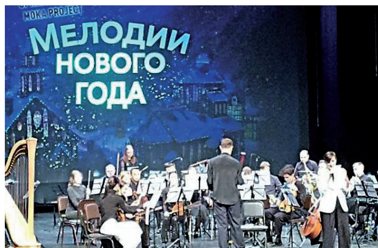
► Новогодние мелодии от артистов Тюменской филармонии