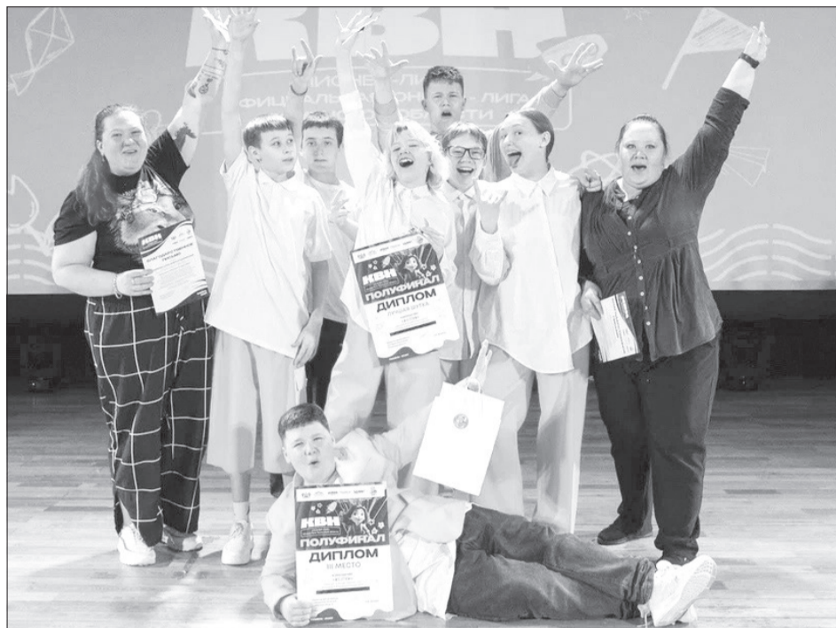
В составе «Желтков» семеро школьников и двое взрослых - звукорежиссёр и руководитель

- Да не пропускаем мы, вы нас сами на игру отпустили!