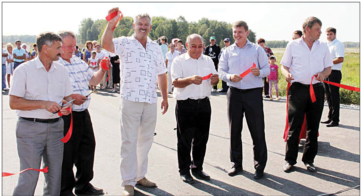
• Символическая лента разрезана. Мост сдан в эксплуатацию.

Оживлённо и празднично было 25 августа у въезда в деревню Преображенка. Здесь состоялся долгожданное событие – торжественное открытие моста через реку Смородинка.