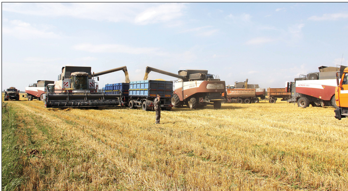
• Уборочнаястрада у аграриев ООО «Сибиря» в разгаре. В погожие дни дорога каждая минута.

Семян засыпано 2 025 тонн из 6 332 запланированных, что составило 32 % от потребности.