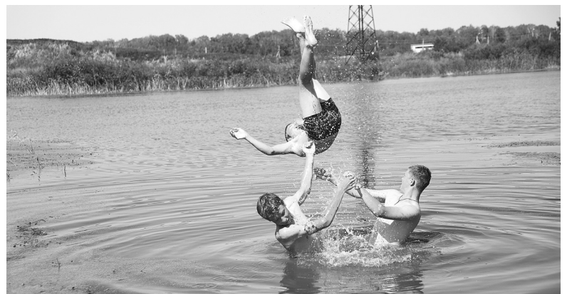
Вода тёплая, как парное молоко. А по анализам – ещё и безопасная