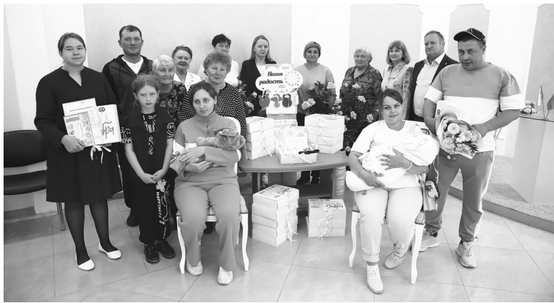
Рукодельницы старшего поколения собрали для грудничков 20 «Коробок добра»