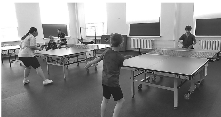
Юные голышмановские теннисисты набили руку на тренировках со спортсменами Тюменского района

вов. В мае этого года здесь прошли состязания по настольному теннису двух областных спартакиад – коллективов ДРСУ и педагогов учреждений среднего профессионального образования.