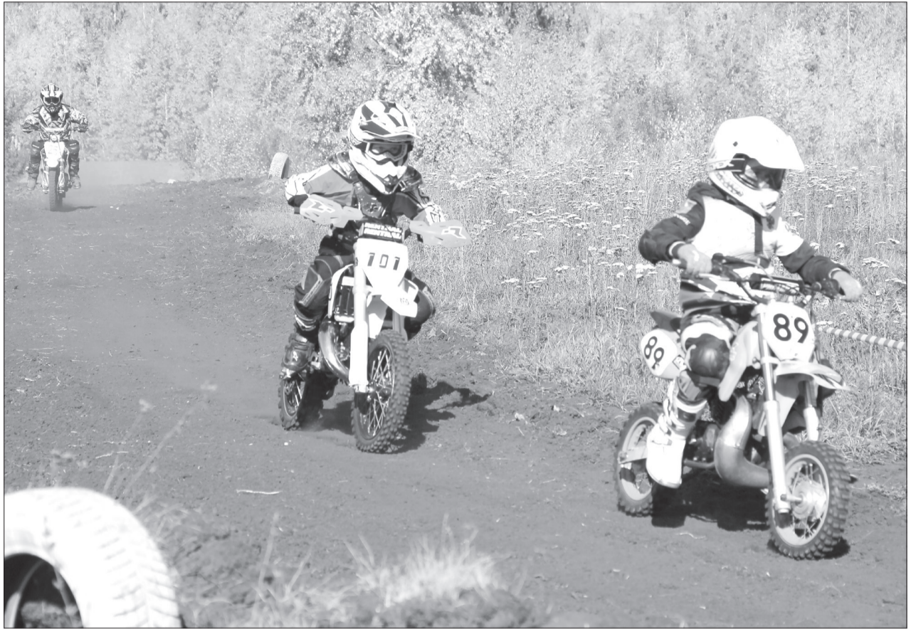
Питбайки относятся к спортивному инвентарю и не предназначены для езды по дорогам общего пользования и тем более по городским улицам

Конструкция таких моделей не предусматривает световых приборов, указателей поворота, зеркал заднего вида и мест для крепления госномера. Приобрести технику может любой желающий без водительского удостоверения, а при выезде на проезжую часть управляющий таким транспортным средством не способен адекватно оценивать дорожную обстановку и информировать других участников движения о своих манёврах.