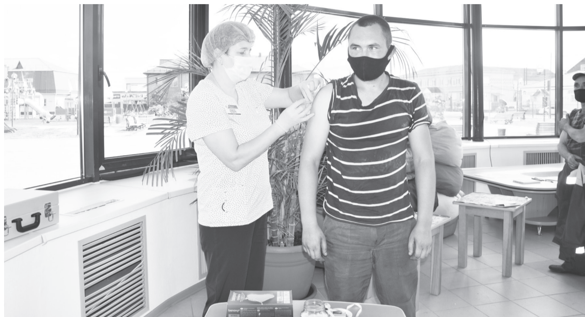
Прививочный пункт в Упоровском РДК работает каждый четверг с 10 до 12 часов.

Сейчас много говорится о коронавирусной инфекции, но люди, которые ею не болели, до сих пор не верят, что это заболевание может нанести непоправимый урон здоровью. А те, кто перенёс болезнь, стремятся как можно быстрее сделать прививку.