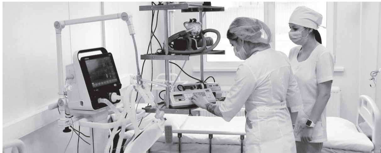
В здравоохранении Тюменской области используется современное оборудование.

Принять участие в формировании народной программы на сайте NP.ER.RU можно двумя способами. Первый – проголосовать за предложения в одном из девяти разделов, охватывающих основные сферы жизни. Каждый из них отражает наиболее важные направления. Второй способ – направить свои предложения через специальную форму. Предусмотрен и офлайн формат – можно заполнить анкету у депутата, избранного от того округа, где проживает гражданин.