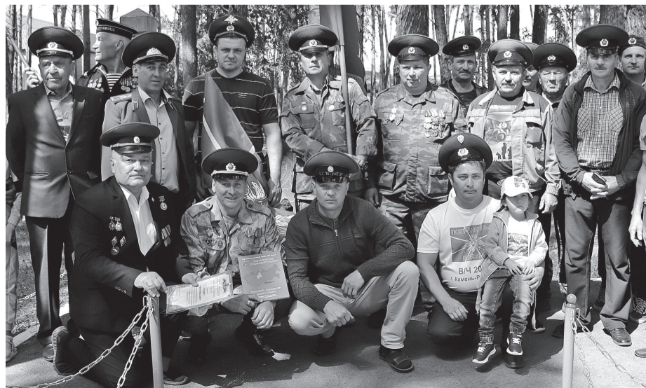
• Вчера, в День пограничника, заводоуковские воины запаса традиционно собрались на торжественный митинг в сквере воинской славы в городе и возложили цветы к памятному знаку «Пограничникам всех поколений».