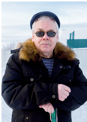
Начало на 1 стр.

Но родители, которые сейчас живут одни в своём доме, довольны: у каждого в жизни своя дорога, каждый нашёл своё дело, обзавёлся семьёй, подарил внуков бабушке и дедушке, о чём ещё можно мечтать отцу с матерью?!