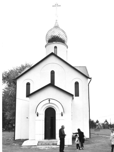
Единственная в регионе старообрядческая церковь

ны. До ближайшего города 70 километров. Устойчивая мобильная связь, интернет, водопровод, подведен газ, налажено автобусное сообщение с райцентром. А еще я сделал вывод, почему наше село называется Окунево. Оказалось, что первые переселенцы пришли на нашу землю из Шадринки и Окуневки. Это Зауралье, ныне Курганская область. Поселение Окунево и по сей день стоит на берегу одноименной речки, богатой окунями. Можно много рассказывать о нашей природе,