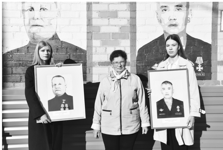
Портреты героев переданы в школьный музей