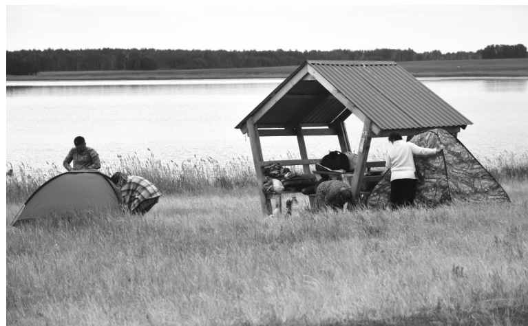
Озеро Соленое привлекательно для туристов