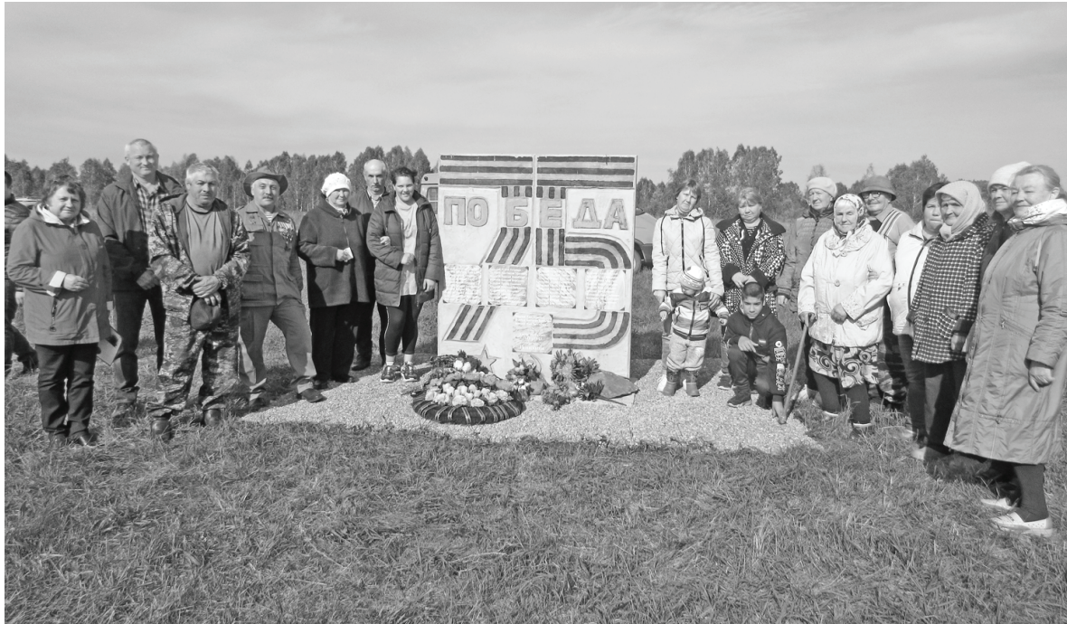
Черноковцы чтят память героев-земляков Великой Отечественной войны

В 1941 году на территории нынешнего Черноковского поселения в трех сельских советах (Черноковском, Копотиловском и Сычевском) находилось 26 населенных пунктов, сегодня осталось пять. На войну было мобилизовано 713 человек, из них 438 не вернулись. Среди них и защитники деревни Ганихина. К 1941 году в деревне имелось 21 хозяйство, а защищать Родину ушло 42 человека, 23 фронтовика не вернулось домой. И сегодня бывшие жители деревни Ганихиной, дети, внуки и правнуки героев Победы собрались на своей