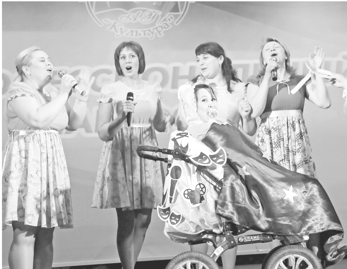
Триумфальное выступление победителей районного фестиваля профессионального мастерства – Тюнёвского сельского Дома культуры.