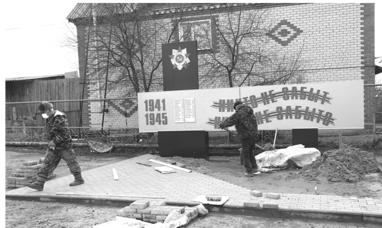
Работники ООО «Голышмановоагропромстрой» ремонтируют ко Дню Победы перенесённый к спортзалу «Лидер» памятник погибшим в годы Великой Отечественной войны

Подготовила Оксана ТИТЕНКО