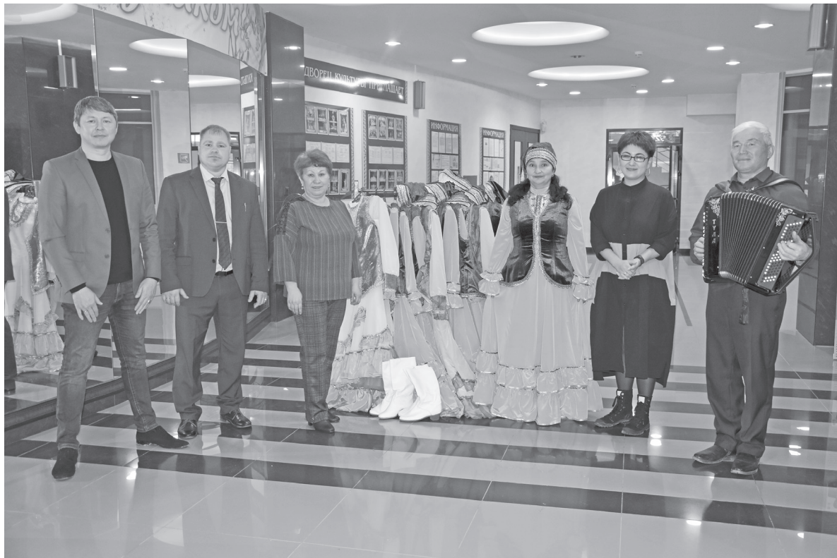
Вручение национальных костюмов и баяна карагайскому ансамблю «Умырзая»