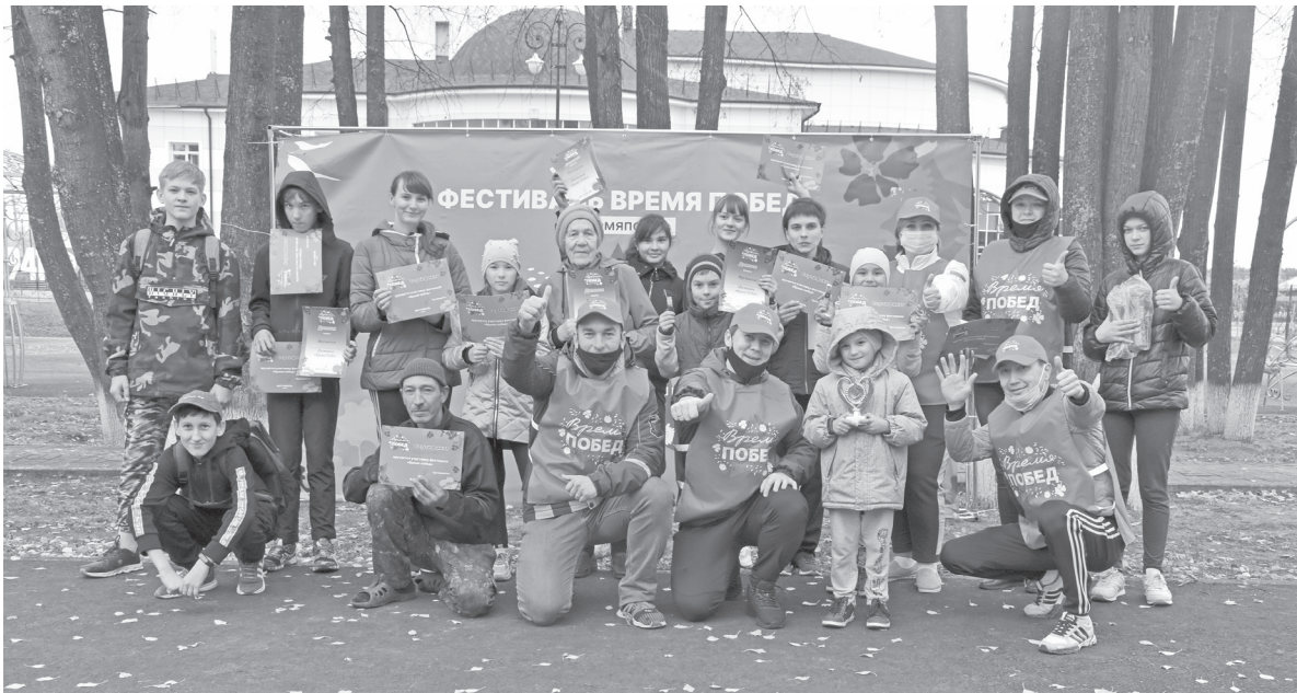
Участники фестиваля «Время Побед»

Осеннее субботнее утро третьего октября в парке Победы собрало на спортивный фестиваль «Время Побед» несколько десятков самых активных вагайцев. Возраст участников варьировался от пяти до 83 лет. Зарегистрировавшись, они разбились по командам и, несмотря на капризы погоды, приступили к выполнению нормативов комплекса ГТО.