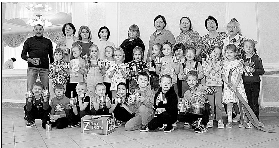
На встрече с ребятами из детского сада.