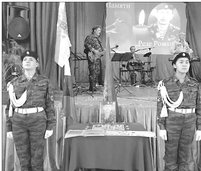
Кадеты Гладиловской школы замерли в почётном карауле

Любовь АЛЕКСЕЕВА.