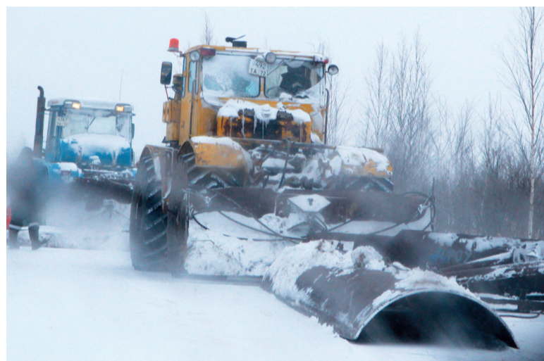
Администрация Тобольского района держит состояние автозимника на постоянном контроле.

Конечно, на территориях, где хорошая связь, эти вопросы можно решать через портал госуслуг, но из операторов у нас только «Теле 2» и интернет работает плохо. Мы поднимали эту тему, но на тот момент технические ограничения нашего энергоснабжения влияли на работу оборудования связи, которое не рассчитано на такие слабые мощности. Теперь, когда станция переведена на круглосуточный режим работы, мы снова намерены обратиться к связистам. Пожалуй, каждый житель Заболотья мечтает о том, чтобы в его доме появился полноценный интернет.