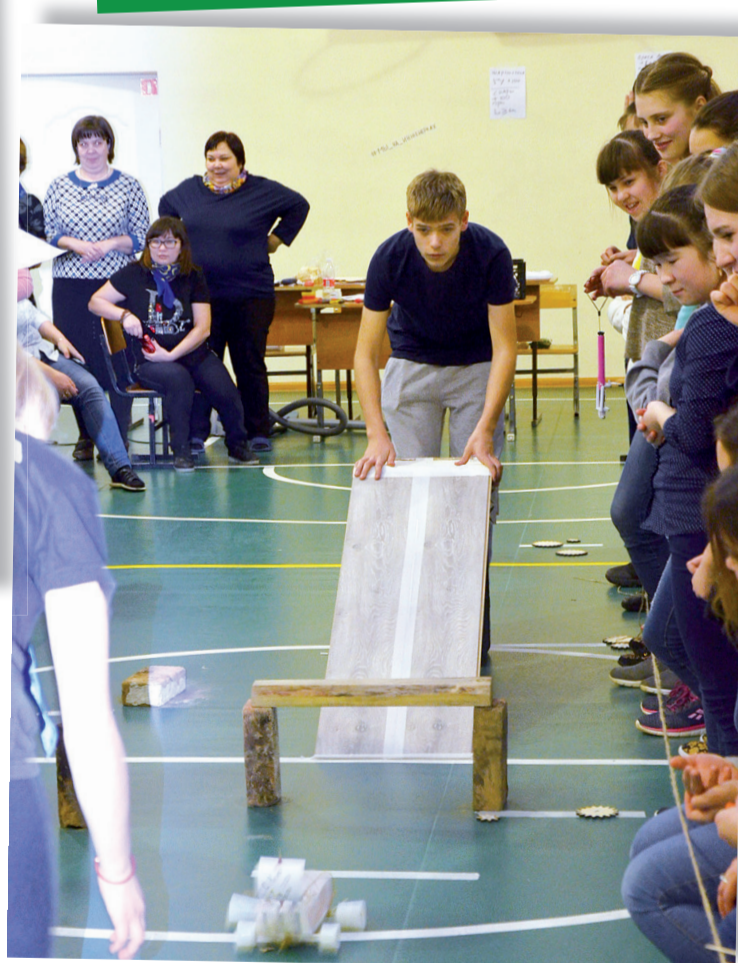
Задача для юных конструкторов – спустить тележку и не разбить яйца.

А они поджидали мальчишек и девчонок сразу же за порогом школьного спортивного зала. Здесь проходили инженерные соревнования под названием