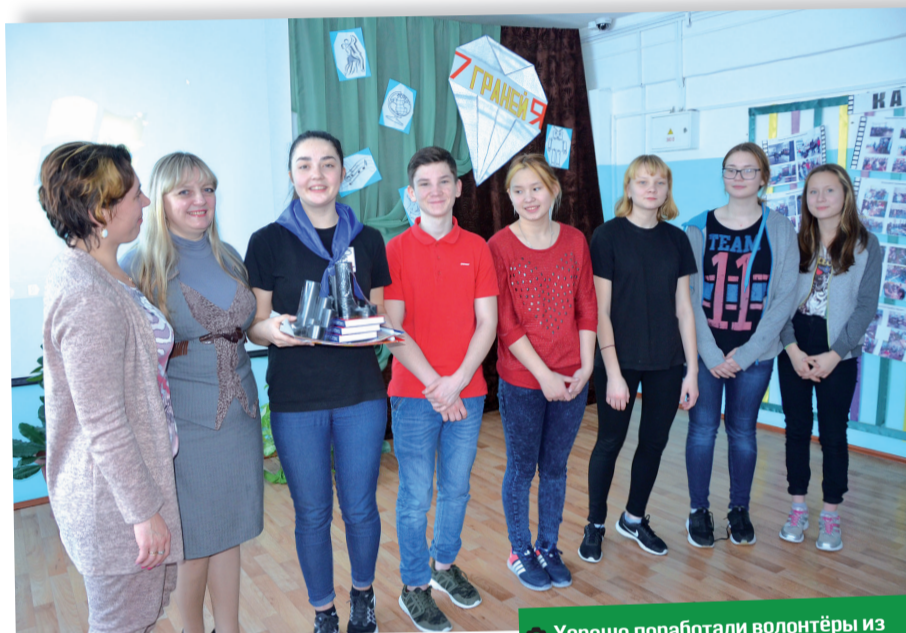
Хорошо поработали волонтеры из Бизинской школы.

А работать над собой, реализовать свой потенциал эти ребята умеют – путёвку на сборы получают, как правило, самые яркие