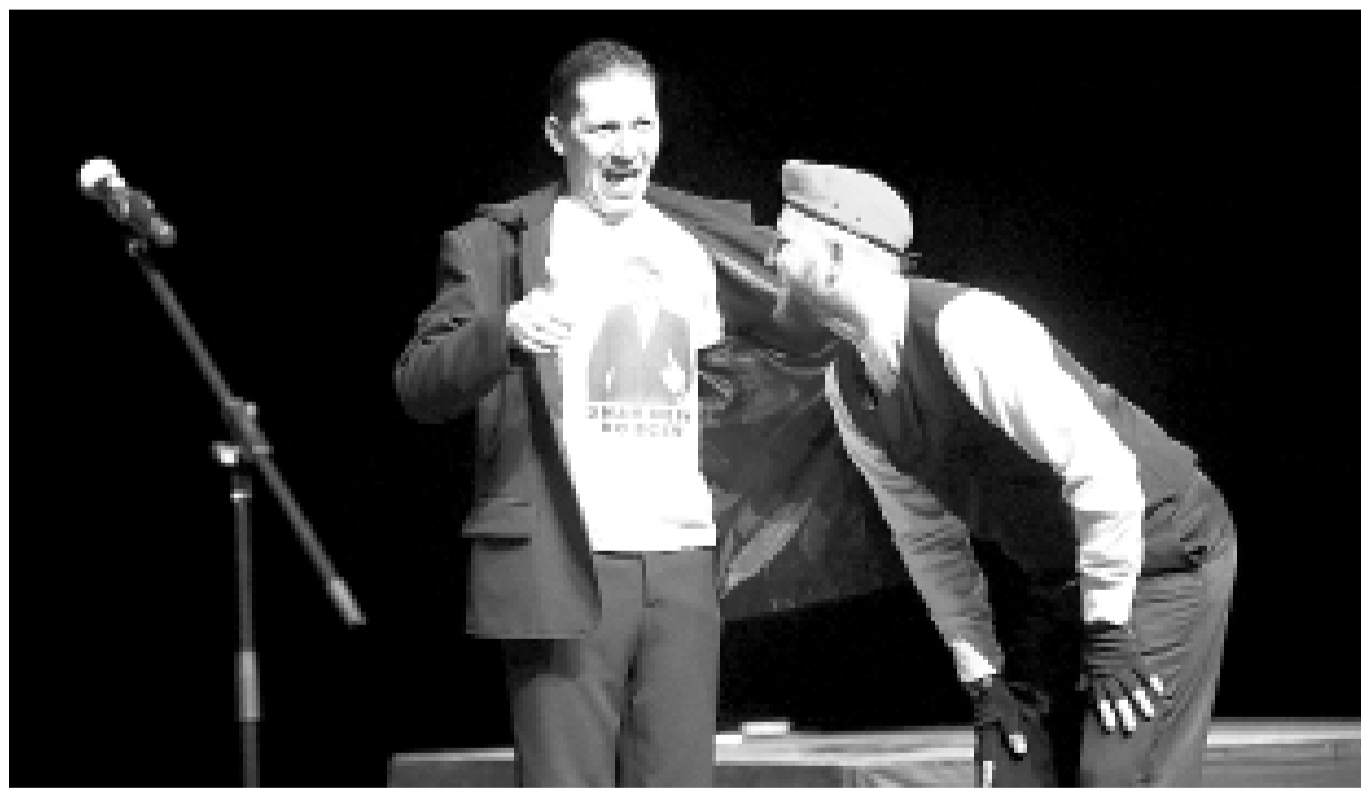
► Шекспировские страсти на тобольской сцене в исполнении орских артистов

Они к нам, мы – к ним. В Тобольске завершились гастроли Орского государственного драматического театра им. А.С. Пушкина. На очереди тобольские спектакли на орской сцене.