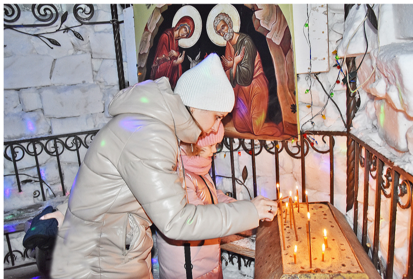
Люди идут в вертеп поклониться Спасителю

Если обратиться к Евангелию, то там очень подробно описано, как именно появился на свет Иисус. Иосиф и Мария, которая в этот момент была на сносях, преодолели долгий путь до Вифлеема, где проводилась перепись населения. Город был переполнен, и пара не могла попасть ни на один постоялый двор. Чтобы не остаться ночью на улице, они были вынуждены остановиться в хлеву, где Мария и родила Сына Божия. Так как у неё практически ничего не было с собой для младенца, она уложила новорождённого в кормушку для скота. Поклониться Спасителю человечества пришли пастухи, к которым явились ангелы и сообщили благовест. Следом за ними прибыли волхвы и принесли младенцу дары. Привела их звезда, загоревшаяся на небе в час рождения Иисуса. С тех пор одной из традиций праздника является украшение ёлки звездой, она будто напоминает о том времени, когда люди получили шанс на спасение своей души.