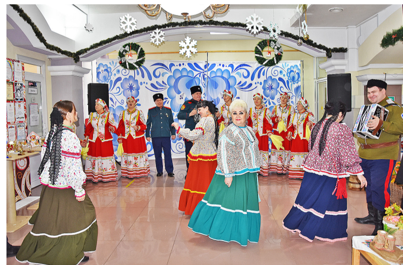
Гости праздника весело отплясывали под зазорную песню ансамбля «Хуторяне»

а также неотъемлемая составляющая настоящего и будущего великой России.