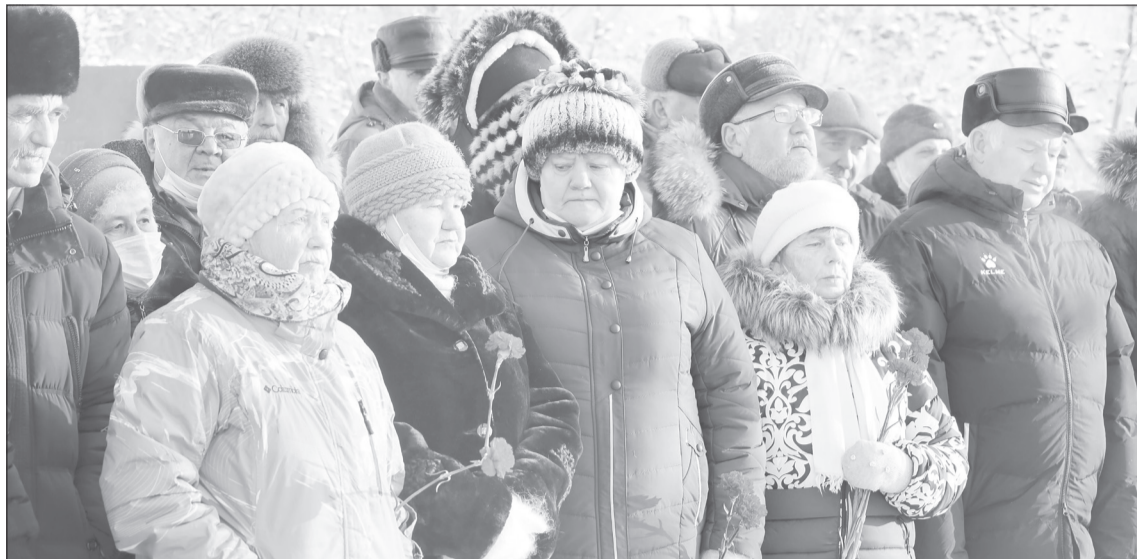
Мороз не помешал ялуторовчанам и жителям района собраться, чтобы почтить память воинов-интернационалистов

К её словам присоединилась и заместитель главы Ялутор-