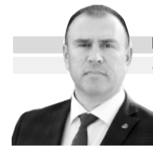
ПЕТР ВАГИН глава города Тобольска

Желаю всем крепкого здоровья, долголетия и благополучия!