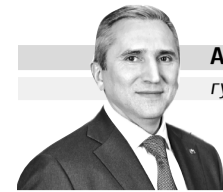
АЛЕКСАНДР МООР губернатор Тюменской области

Уважаемые жители региона старшего поколения! Дорогие земляки!