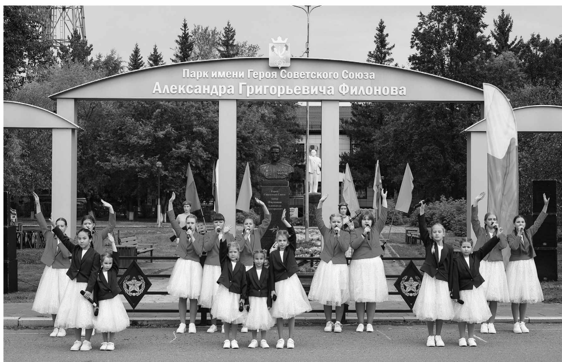
Вокальная студия «Овация» исполнила песню «Журавли Победы»

В рамках встречи прошло показательное выступление смо-