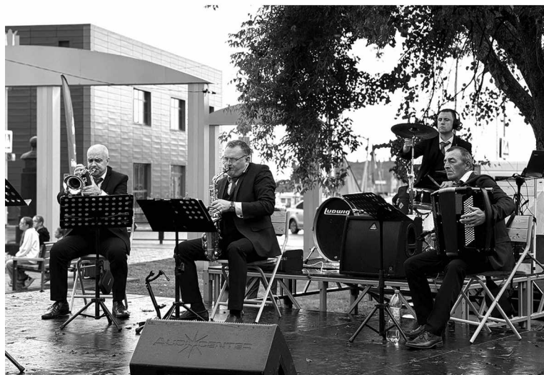
Ишимский ансамбль эстрадных духовых инструментов покорила омутинцев своим исполнением

Здесь можно было найти развлечение на любой вкус. Повсюду - тематические островки с активностями, организованные муниципальными учреждениями. Культурные центры сельских домов культуры и Движение Первых предлагали декоративно-прикладные мастер-классы по созданию патриотических аксессуаров. Юные художники Детской школы искусств, вооружившись мольбертами и красками, рисовали военную технику. Центр внешкольной работы разбил лагерь с привалом, образцами оружия, медициной и интеллектуальными играми. Желающие принимали участие в медицинском мастер-классе от