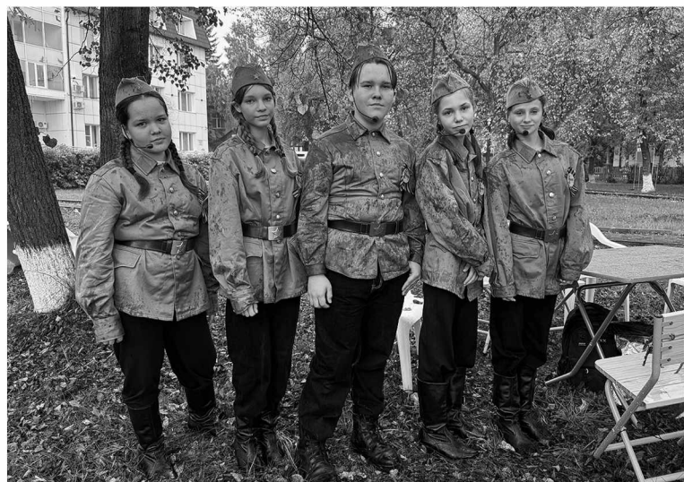
Вокальная группа «Ассорти» Вагайского СДК выступила в патриотичных образах