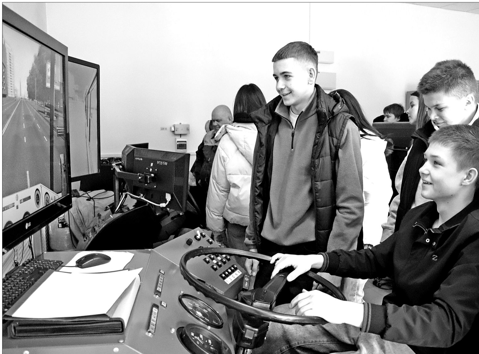
Школьники с большим удовольствием по очереди «ездили» на автотренажёрах в учебном классе Завоудковского отделения агротехнологического колледжа.

Профориентация. Федеральный проект «Билет в будущее» помогает школьникам выбрать профессию