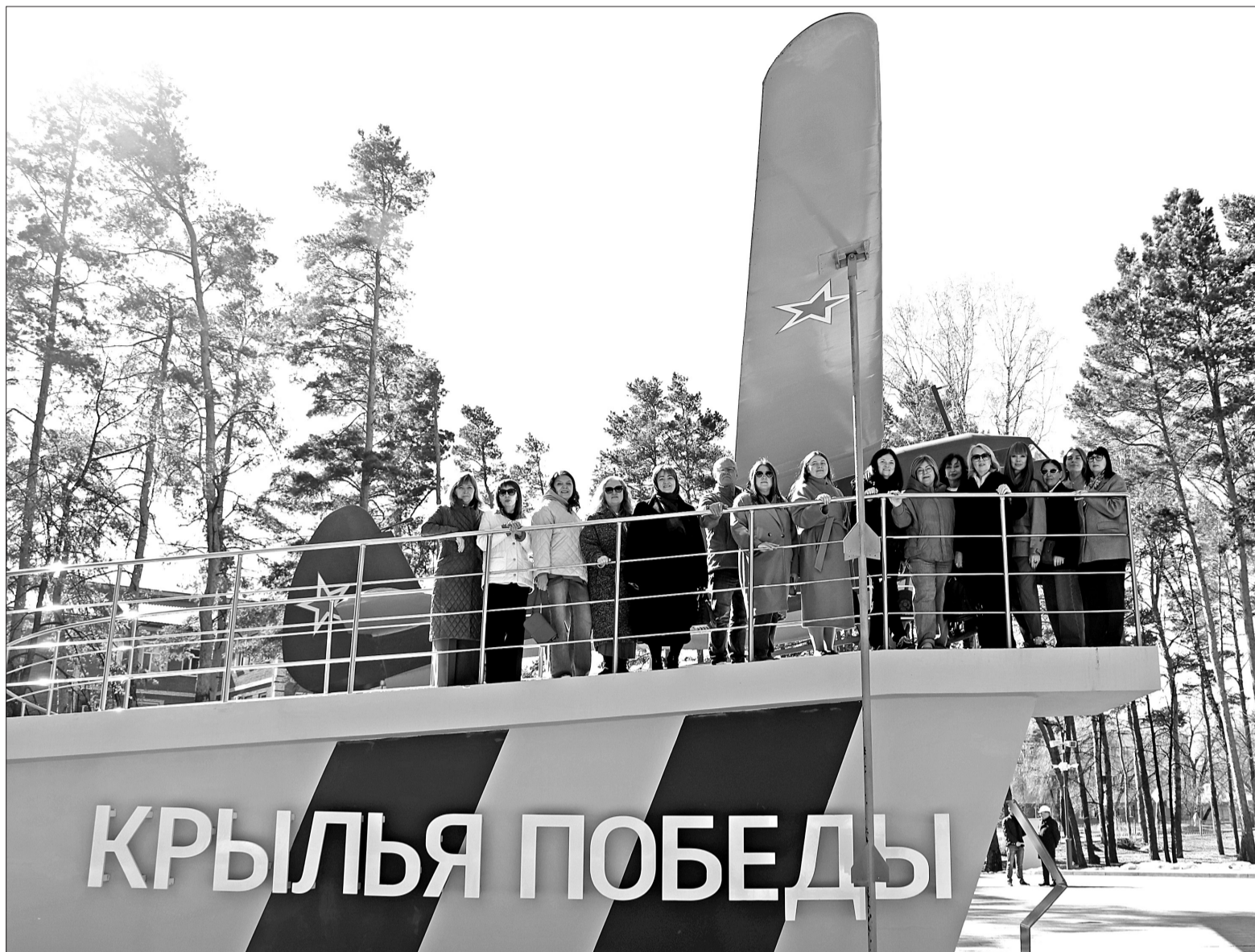
Во время визита в Заводоуковск делегация Тюменского регионального отделения общероссийской общественной организации «Деловая Россия» побывала на предприятиях, посетила центральный парк, парк машиностроителей, обновлённую центральную площадь и отведала колмаковского пряника в «Настоящей пекарне».