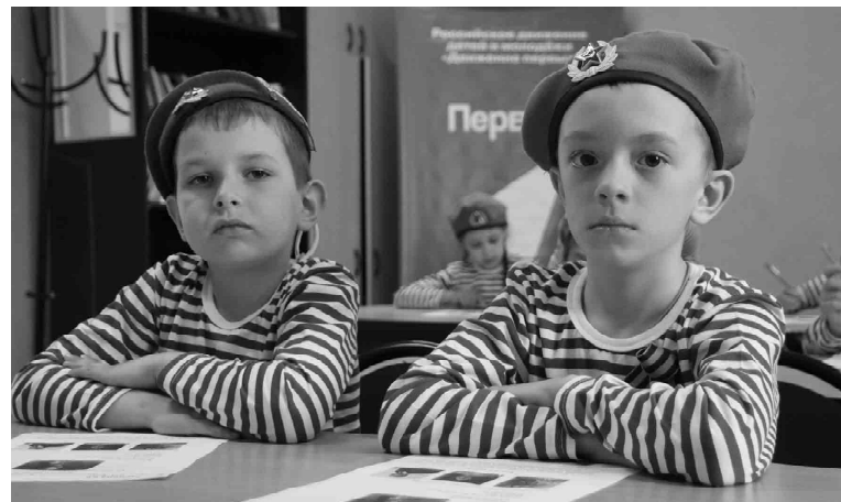
Юные участники игры из отряда «Патриот» (Омутинская школа № 2) показали теоретические знания по истории Отечества

Девять отрядов проверили свои знания и навыки в испыта-