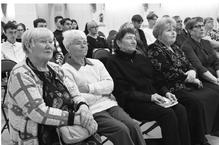
Увлеченные поэзией омутинцы познакомились с творчеством автора

тровграде. Когда-то она работала в школе, СМИ и на предприятиях Росатома. Автор шести поэтических сборников «А любовь живет...», «Просто - Любовь...», «Здравствуй, день!», «Круговорот любви» и других награждена медалью «А.С. Пушкин - 220 лет». С 2012 года