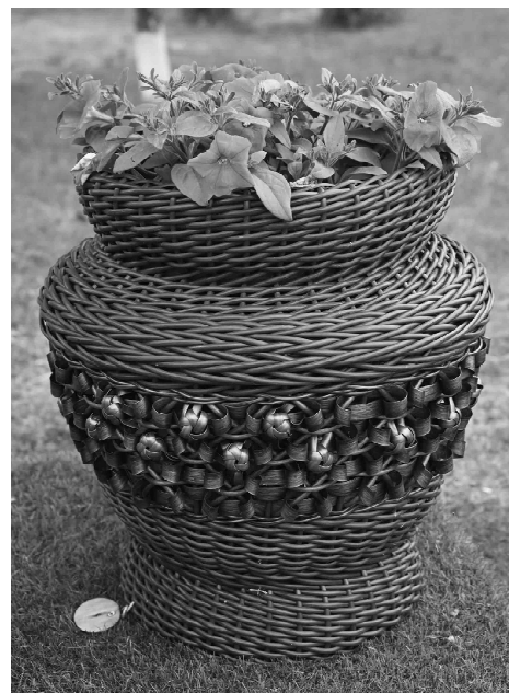
Полимерная лоза не боится влаги, солнца и перепадов температур

- Стою, размышляю... математика, экономика, какая разница, везде цифры, к тому же на матфаке писали