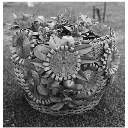
Изделия из ротанга можно эффектно декорировать - это добавляет им индивидуальности