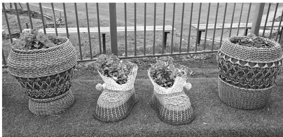
Хобби отлично тренирует логику, интеллект и объемное воображение