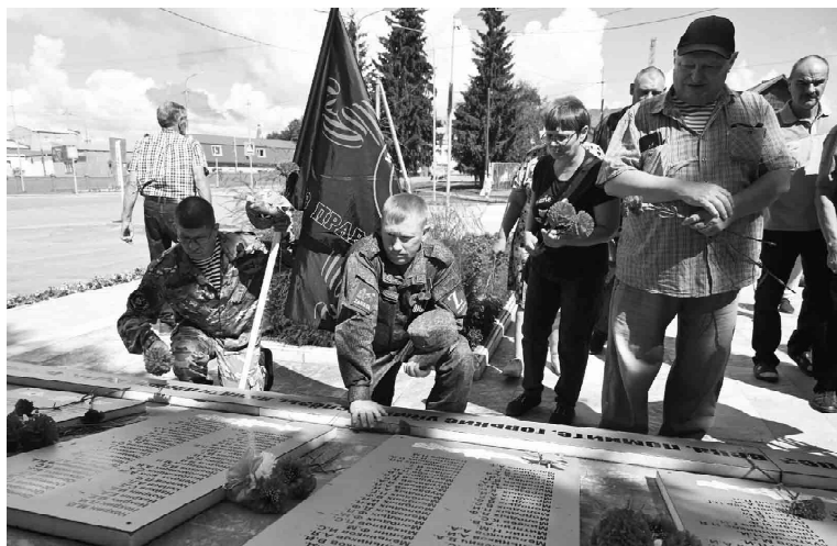
Участники торжества возложили красные гвоздики на мемориальные плиты с именами воинов-земляков

История Омутинского края полна примеров мужества и самопожертвования. В прошлом многие наши земляки в трудный час отправлялись защищать страну, свой дом и близких. Память о них жива в сердцах потомков.