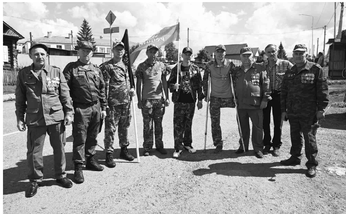
Ветераны боевых действий рады встрече с товарищами