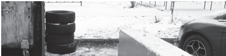
В ООО «ТЭО» призывают водителей не оставлять шины на контейнерных площадках

Напоминаем правило: отслужившим покрышкам не место на площадках для коммунальных отходов. Региональный оператор не только не уполномочен их вывозить, но и более того – не имеет на это права. Состав автошин токсичный, в связи с чем такой вид отходов относится к опасным. Размещённая на почве шина выделяет вредные вещества в воздух и почву, они проникают в грунтовые воды, отравляя окружающую среду. Поэтому утилизировать их необходимо в соответствии с требованиями законодательства.