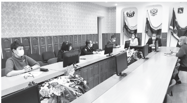
Состоялось заседание оперативного штаба по недопущению завоза и распространения коронавируса