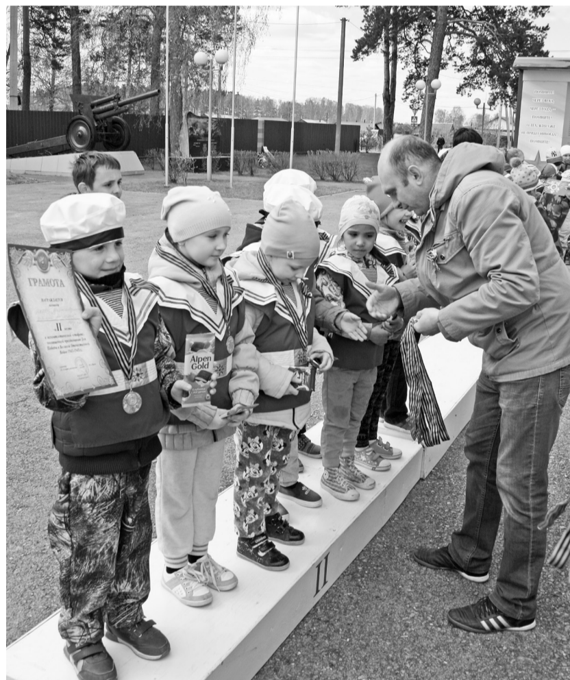
Торжественный момент! Второй корпус детского сада «Колосок» получает медали серебряных призёров.

ников стартовала с площади Победы, маршрут состоял из десяти этапов общей протяжённостью более трёх километров. Победителями легкоатлетической эстафеты стали учащиеся Велижанской школы, второе место завоевала команда Нижнетавдинской школы. Замкнули тройку сильнейших дети из Чугунаевской школы.