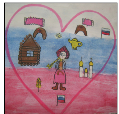
• Рисунок Саша Коноваловой.

Маша: – Думаю, что День народного единства – это когда разные люди, а в области у нас проживают татары, русские, украинцы и много других, а в стране ещё больше – между собой сплочённые. Все показывают, что нужно дружить, не надо враждовать, а быть в единстве. Есть даже известные слова: «Когда мы едины, мы непобедимы».