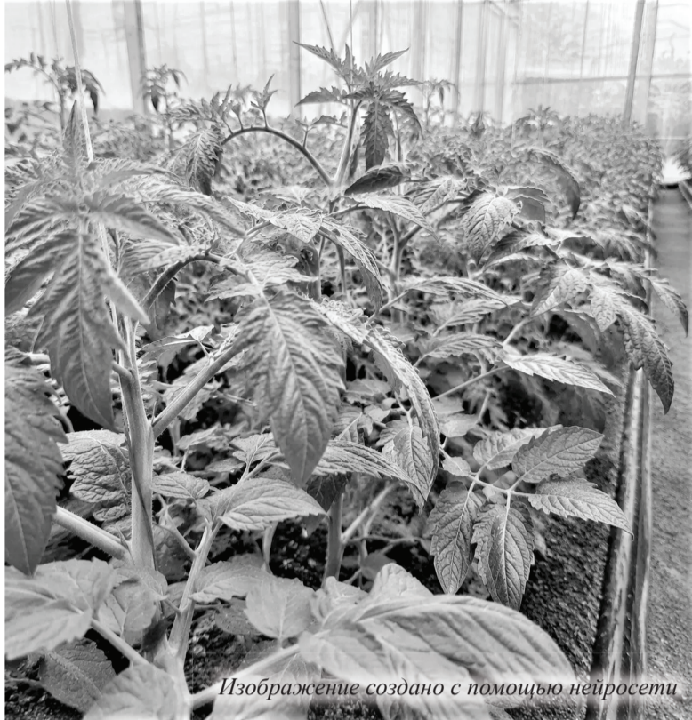
Изображение создано с помощью нейросети

Повторный полив после высадки следует проводить только через 10–14 дней. Такой подход стимулирует корневую систему активно искать влагу в разных слоях почвы, благодаря чему корни становятся разветвлёнными, а не поверхностными. А чем мощ-