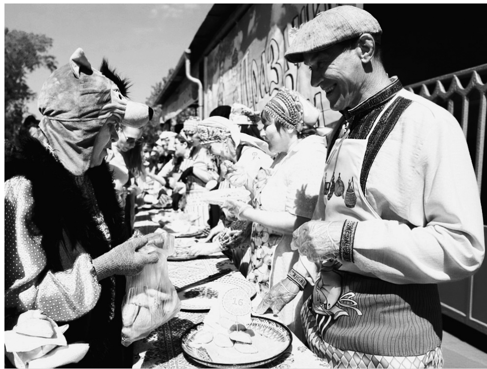
Конкурсанты угощали всех желающих аппетитными пирожками, приготовленными по своим рецептам. Кстати, некоторые хозяйки поставили мужей на раздачу угощений во время дегустации

17 человек участвовали в кулинарном конкурсе на семейном празднике пирога в селе Голышманово