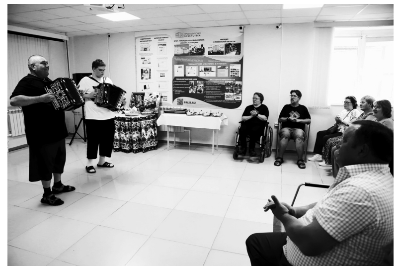
Участники мероприятия «В семейном кругу» демонстрировали таланты: играли на музыкальных инструментах, читали стихи, пели, мастерили поделки и представляли семейные реликвии