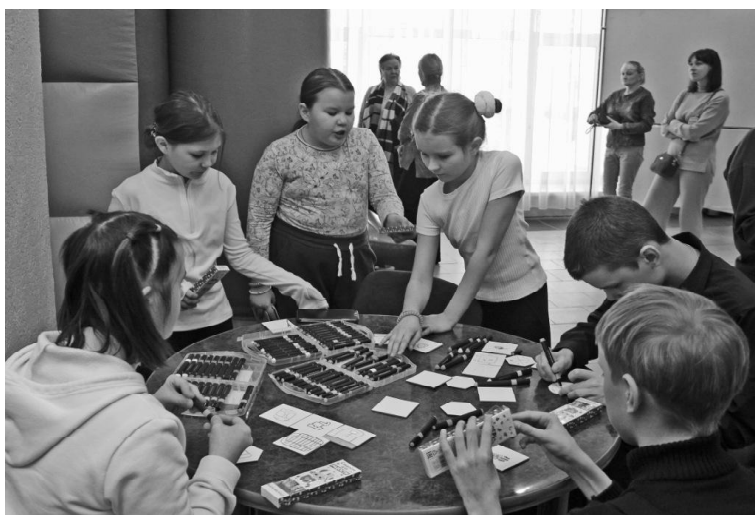
➤ Роспись магнитиков