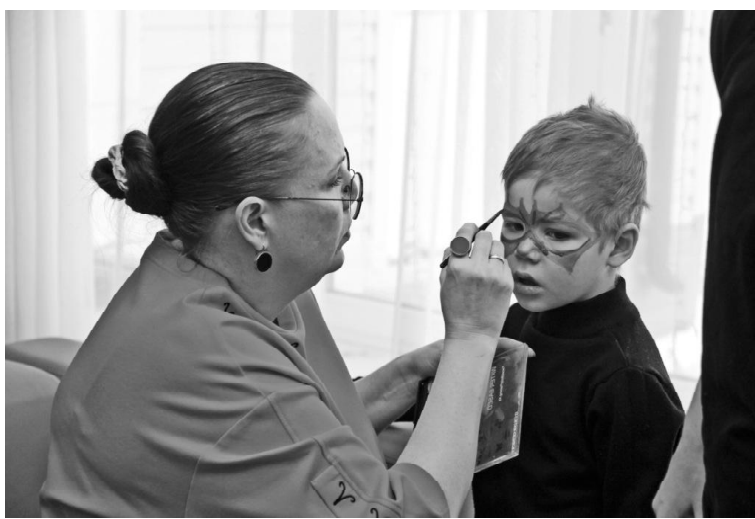
➤ В арт-зоне

В декабре в Викуловском районном Доме культуры прошла интерактивная программа для детей-инвалидов «Счастливое детство». Сюда были приглашены дети как из райцентра, так и из сёл и деревень Викуловского округа. Мероприятие прошло в рамках Декады инвалидов.