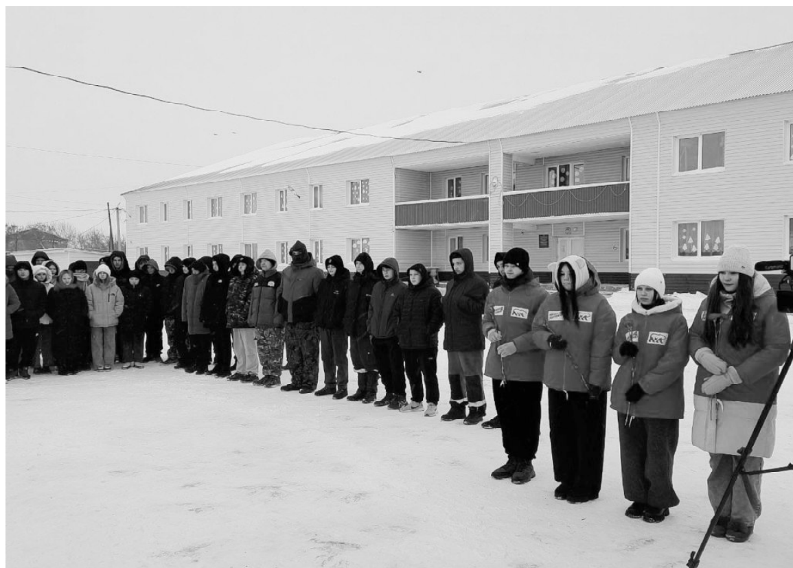
➤ Студенты техникума и гости на открытии баннера