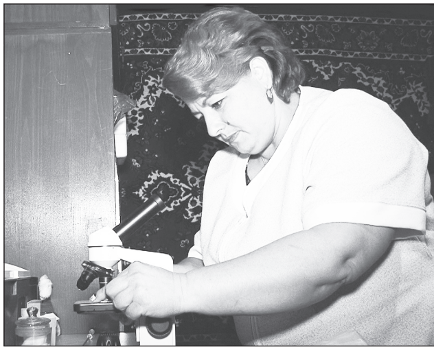
Работа техника-осеменатора требует точности и сноровки.

машины. Около восьми лет назад ей вновь предложили заняться искусственным осеменением КРС, только в этот раз в личных подворьях граждан.