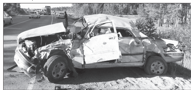
Трагедия на автодороге Тюмень-Боровский-Богдинский.

28 августа в девятом часу вечера на 99-м километре федеральной