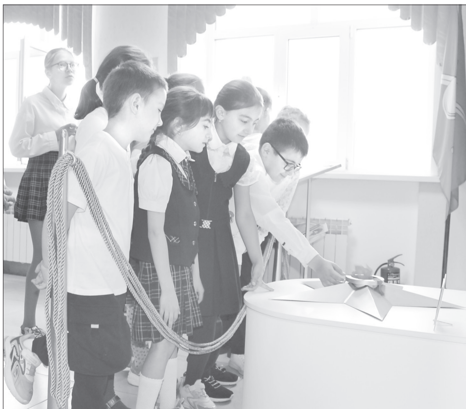
Безопасный искусственный огонь вызвал интерес у школьников. Вместо языков пламени - отрезки тонкого материала

- В этом году нашему выпуску исполнилось 40 лет. Мы решили сделать школе подарок. Нас поддержали другие выпускники, скинулись кто сколько мог. Договорились с руководством школы. Рисовали эскизы, согласовывали, наш специа-