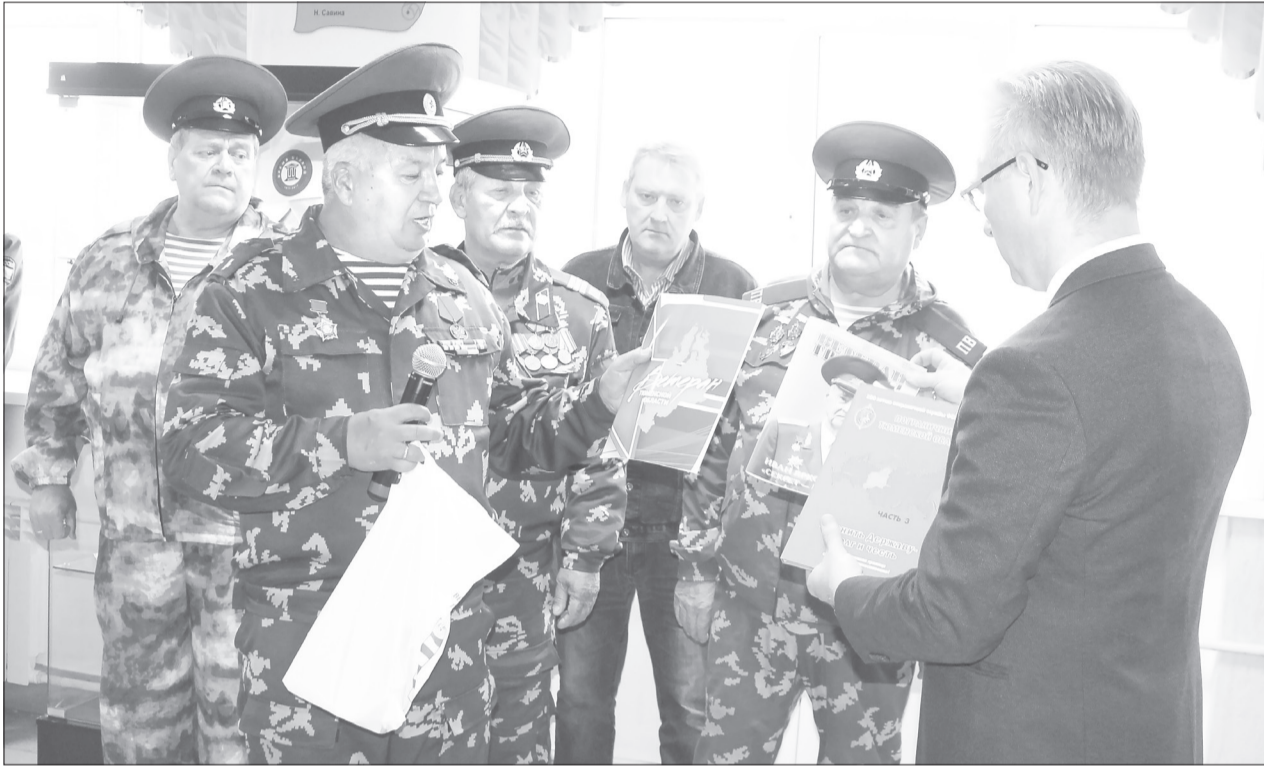
Среди ветеранов, которые присутствовали на митинге, были участники боевых действий, отражённых на мемориальной стене

В первой школе создали мемориал российским воинам