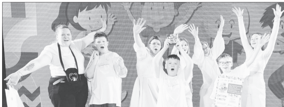
Каждый сезон команда «Желтки» с финала областной «Пионер-лиги» привозит победы или призовые места

Соперниками стали семь коллективов из Тюмени, Ишима, Заводоуковского городского округа, Тюменского и Бердюжского районов. В финале было два конкурса: «Салют» - приветствие и «Знакомый сюжет» - инсценировка известных сказок, но со своим видением. «Желтки» показали сказку «Медведь