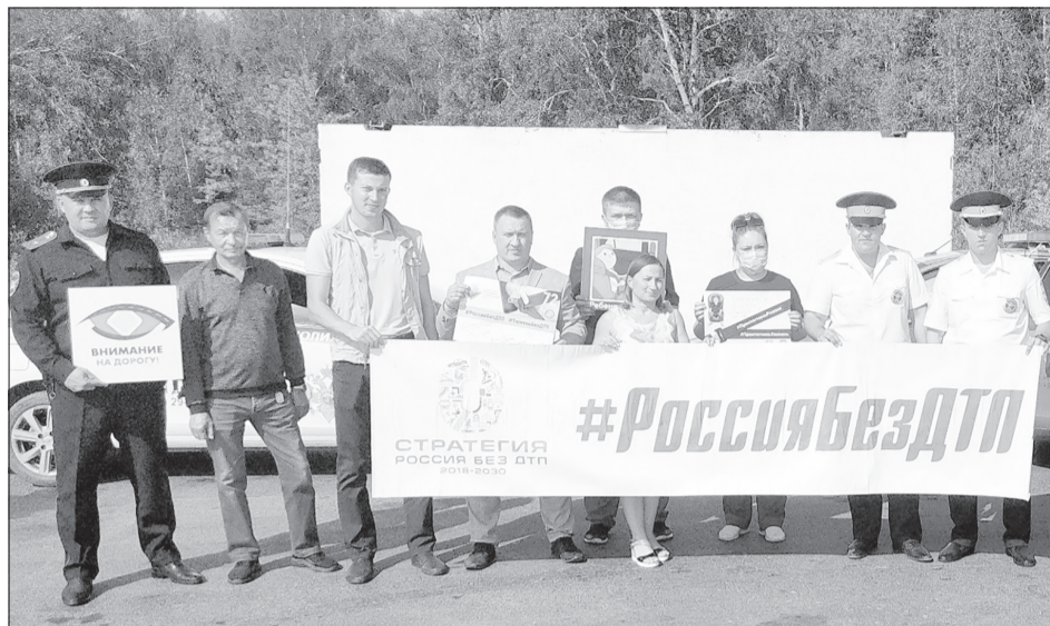
Сотрудники дорожной полиции регулярно проводят профилактические акции, в которых участвуют и другие службы

Трагедия произошла в январе на 46 км трассы Тюмень - Омск. Водитель автомобиля Toyota Vitz из Асланы зацепила на встречку и врезалась в Kia Sportage. Она скончалась до приезда скорой помощи, а малыш - по дороге в больницу. Второй ребёнок был госпитализирован с сотрясением головного мозга и закрытой черепно-мозговой травмой. У водителя Kia компрессионный пе-