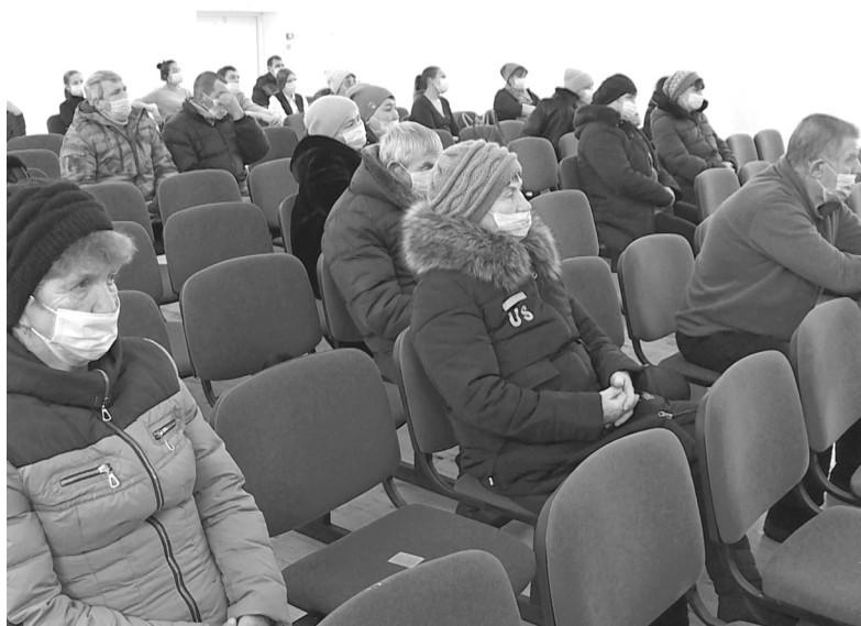
Большинство земляновцев – активные участники общественной жизни

На Земляновской территории прошла встреча с руководством Голышмановского городского округа, которую селяне ждали полтора года. Провести её весной помешали ограничения. Насущные проблемы решались в дистанционном режиме, но диалог в привычном формате обозначил ещё вопросы.