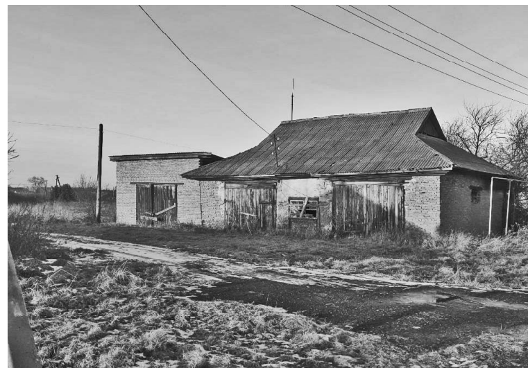
➤ Здание пожарной охраны из гольцовского кирпича