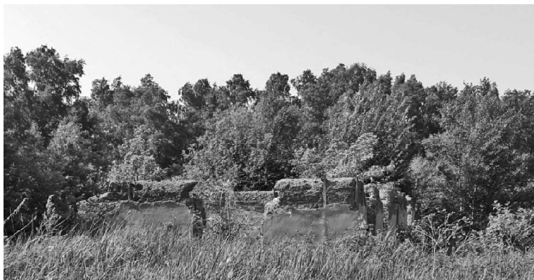
➤ Руины здания, находящегося вблизи Чуртанского кирпичного завода

– Это наш кирпичный завод на работу зовёт, – с гордостью говорят колхозники. И эта гордость вполне законна...» Так повествует книга «Счастье пришло в село Чуртан», написанная редактором газеты «Тюменская правда» Алексеем Неждановым, и изданная в 1958 году. Да, был когда-то в Чуртане собственный завод, на котором производили качественные кирпичи. И с этого протяжного гудка начинался каждый рабочий день для десятков сельских тружеников.