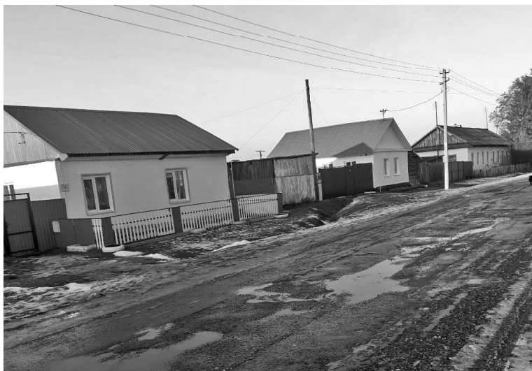
➤ Первые кирпичные дома на улице Новосоветской в с. Чуртан