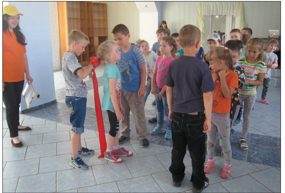
• Завязать бант с первого раза смогли не все участники игры.

На вопрос «Что тебе больше всего понравилось сегодня?» активный мальчик