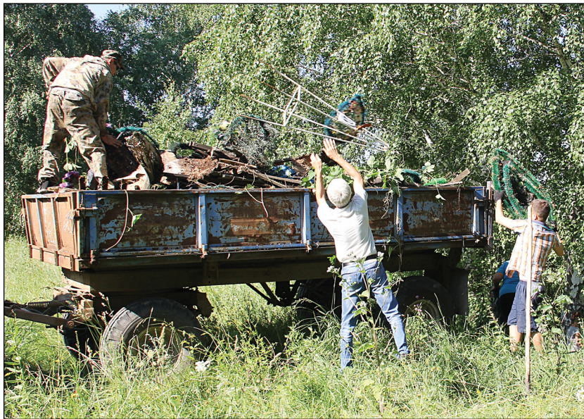
• Большекарединцы очистили берег старицы Вагая от мусора.

Всего в этот день в акции приняли участие более пятидесяти человек, которыми на свалку было отправлено более 20-ти кубометров мусора.