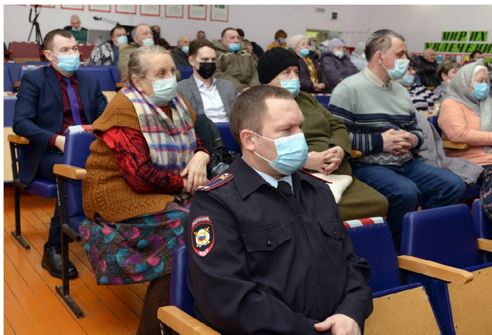
Собрание жителей прошло с соблюдением профилактических требований