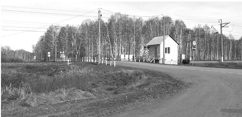
В этом году отремонтировали проблемный участок от железнодорожного переезда до въезда в посёлок Ламенский с южной стороны

Очередная встреча руководителей округа с населением прошла на Ламенской территории.