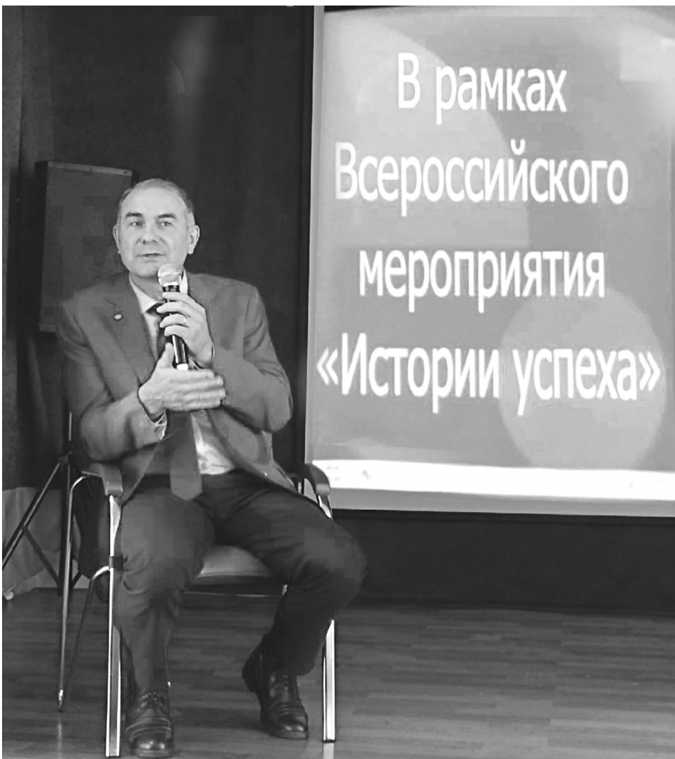
Студенчество – оптимальная пора для старта к успеху и выбора жизненного пути!