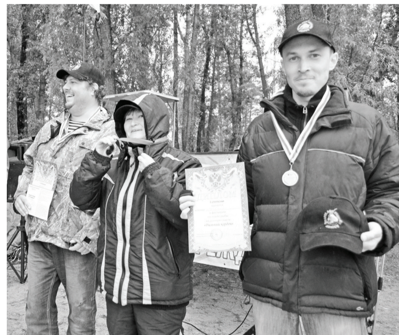
Счастливые участники фестиваля.