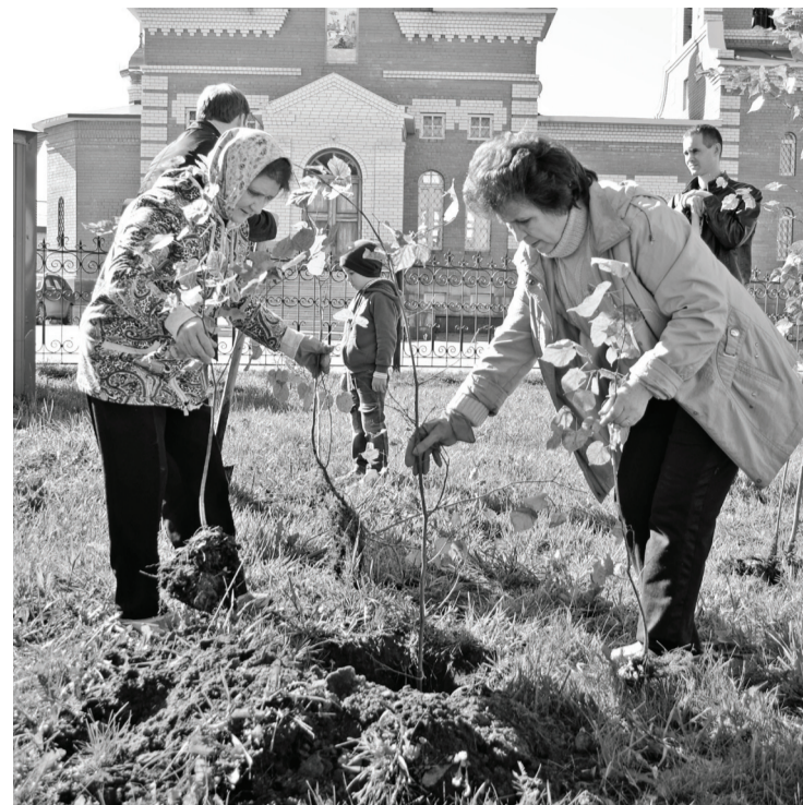
Ещё 60 деревьев украсили аллею Ветеранов в Нижней Тавде. Участие в посадке приняли члены ветеранской организации, представители администрации района и районной Думы.

Добавим, что проект «Лес Победы» стартовал ровно год назад. Проходит он по всей