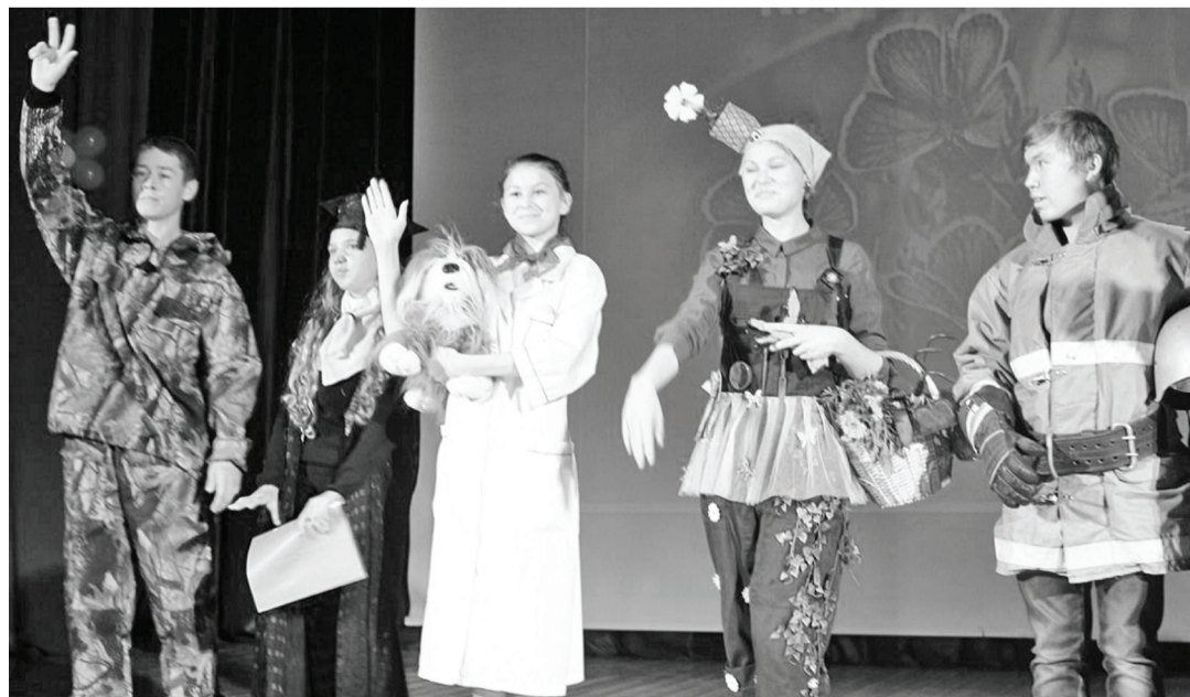
Парад-дефиле рабочих профессий на закрытии «Трудового лета-2015».

Елизавета ФОМИНЦЕВА, Михаил ПЕТЕЛИН (фото)