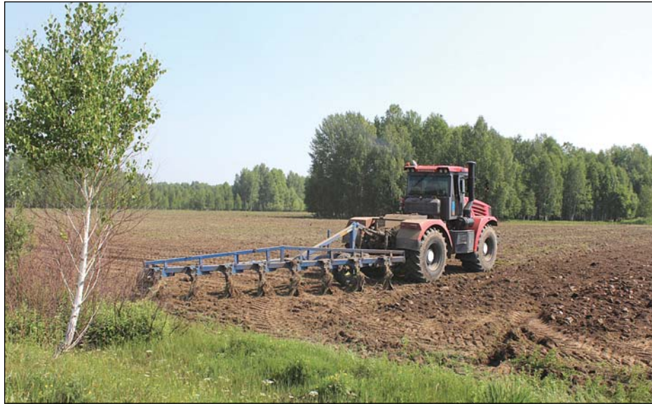
• Расширение посевных площадей производит агрохолдинг «Аромашевский».