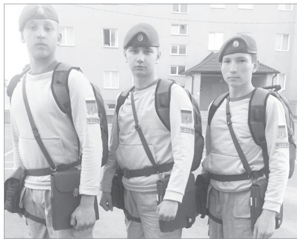
Экипировка юнармейцев самая что ни на есть военная