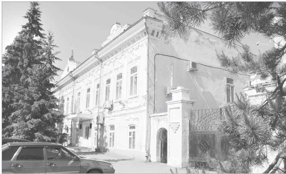
Здание, где сейчас размещается администрация района, пожалуй, одно из самых красивых в городе. Этот особняк был построен в 1896 году

Отправимся на прогулку по исторической улице. Конечно, облик у неё давно уже не тот. За десятки лет своей жизни дома не раз перестраивались, уцелевшие старинные особняки нередко «закрыты» современными материалами. А замена оконных рам неизбежно влечет утрату ин- терсных наличников.