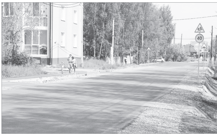
Широким полотном раскинулась новая дорога на ул. Менделеева. Здесь же оборудован удобный тротуар и расширена парковка у детского сада

В администрацию неоднократно обращались жители новостроек с улиц Полковникова, Жигайло, Артемьева, Филиппова с просьбой обустроить местные дороги. Дома здесь частично