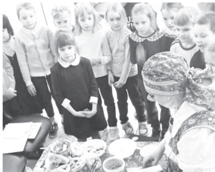
|| Фото из архива РДК

виды чая: чёрный, зелёный, фруктовый, все они очень вкусные. А вот моя бабушка сама его делает – летом собирает листья смородины, малины, душицу, мяту, мелиссу, а зимой мы добавляем их в обычный чёрный чай и пьём, – рассказывает один из участников мероприятия.