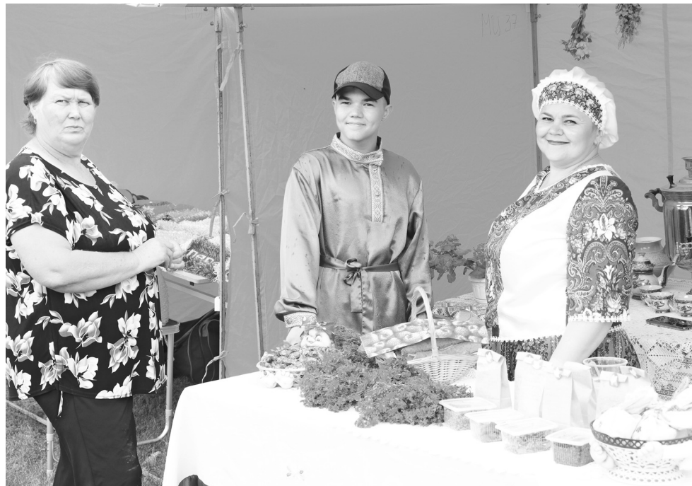
Добрими улыбками, горячим чаем встречали гостей евсинцы

– Женщину-охранницу приусадебного участка смастерила на славу, хотя раньше никогда этим не занималась. А щедрую корзинку несложно было собрать: в нашем огороде к началу августа всё созрело – капуста, в том числе цветная, свёкла, морковь, картофель, баклажаны, огурцы, помидоры. В этом году вырастить урожай было непросто. В засуху поливали посад-