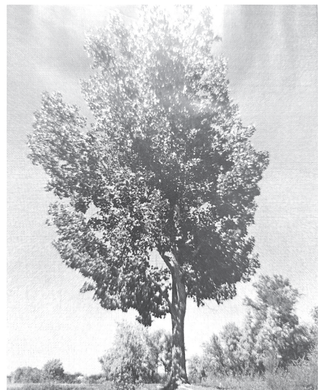
► Тополь Софьи Алексеевны