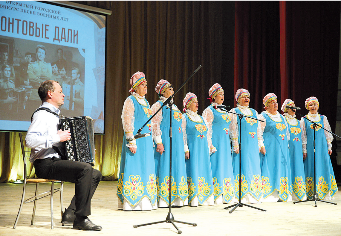
Ансамбль ветеранов «Малые зори»